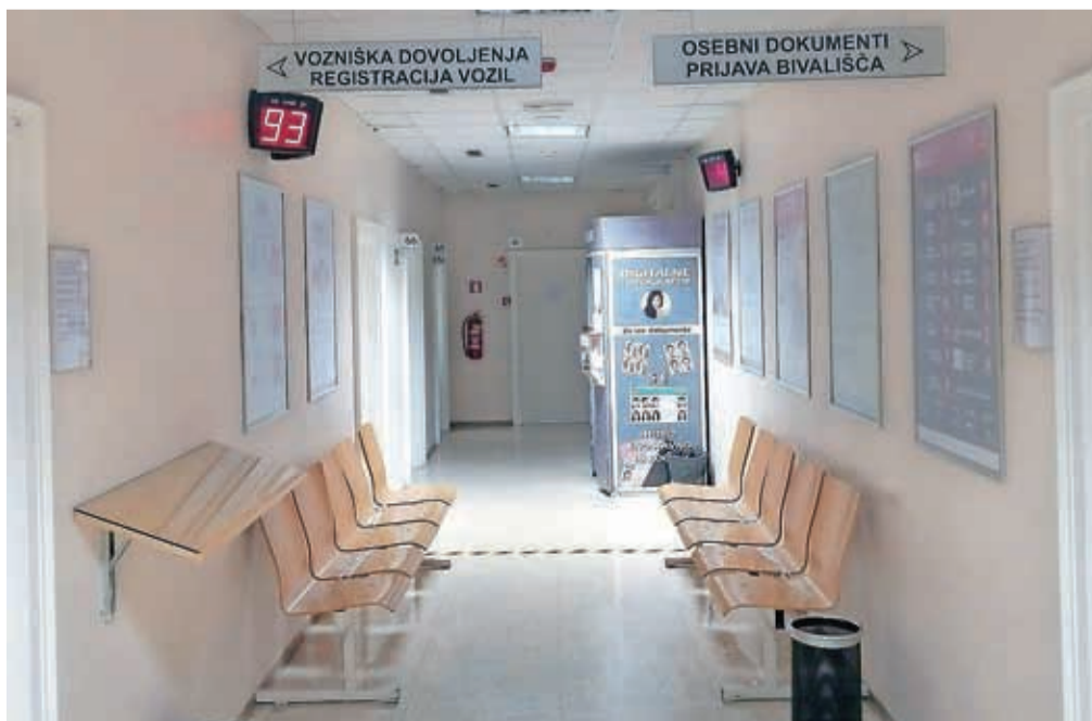
Eden bolj obleganih hodnikov Upravne enote Kranj

Mestne občine pa ob tem skrbijo še za razvoj mesta kot celote, za mestne prometne naprave in mestne javne zgradbe, določajo namembnost mestnega prostora, urejajo mestni promet, zagotavljajo delovanje informacijsko-dokumentacijskih, kulturnih, znanstvenih, socialnih, varstvenih in zdravstvenih ustanov, ki imajo pomen za širšo lokalno skupnost, skrbijo za varstvo naravnih in kulturnih spomenikov na območju mesta, ki so lokalnega pomena.