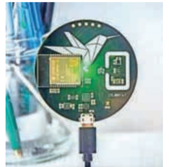
Model Colibri Air za merjenje kakovosti zraka

Delavnice digitalnih veščin na daljavo že potekajo za osnovnošolce od 7. razreda naprej. Še posebej veseli zanimanje učenk, ki so včasih zadržane do tehnoloških znanj. Udeleženci izdelujejo računalnik Colibri Air s senzorji za zaznavanje temperature, vlage, osvetlitve in kakovosti zraka, kar je v času