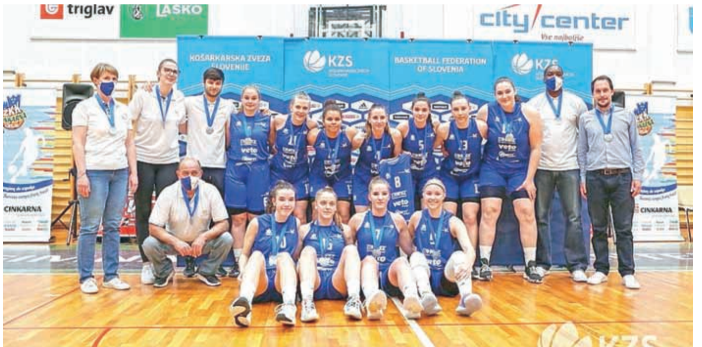
Košarkarice Triglava so po drugem mestu v pokalu tik pod vrhom končale še v državnem prvenstvu.