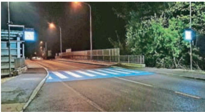
Prehod za pešce pri nadvozu čez avtocesto na Kokrici je zaradi sodobne osvetlitve in dobro vidnih talnih označb zdaj bistveno varnejši.

optiko, tako da osvetljujejo celotno območje. Ko senzor zazna pešca, vklopi rumena utripalca (podnevi in ponoči), LED-svetilki (v temnem delu dneva) močneje zasvetita in tako opozorita na prisotnost pešcev na prehodu. Na tak način kot na Kokrici so letos opremili tudi prehod za pešce na Jelenovem klancu in osvetlili še stopnišče, ki povezuje Jelenov klanc s Staro cesto in Majdičevim logom. Pešči so zaradi izboljšav zdaj bolj vidni, še zlasti v nočnem času, vendar varnost zaradi posameznih voznikov še vedno ni zagotovljena. Medobčinski redarji so namreč med 28. aprilom in 5. majem na omenjeni lokaciji dvakrat opravili meritve hitrosti s samodejnim merilnikom. Zaznali so deset prekrškov, tudi dve izredni prekoračitvi hitrosti: 123 in 110 kilometrov na uro. Za oba voznika bodo sodišču predlagali začasni odvzem vozniškega dovoljenja.