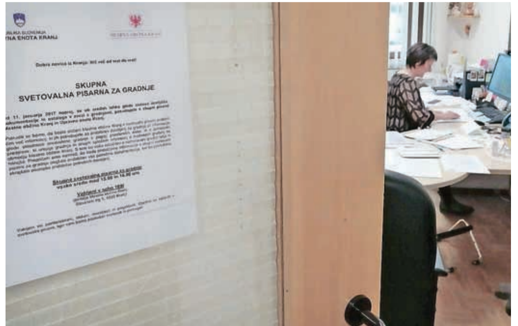
Skupna svetovalna pisarna za gradnje, ki sta jo Mestna občina Kranj in Upravna enota Kranj ustanovili leta 2017

Župani nimajo neposrednega vpliva na sprejemanje in spremembe zakonodaje, a so na kranjski občini s ciljem, da zakonodajalcem predstavijo in predlagajo možne rešitve za boljše vključevanje tujcev v lokalno okolje, lani poleg Sosveta za varnost ustanovili še Posvetovalno komisijo za tujce, ki obravnava problematiko priseljevanja tujcev. V njej so predstavniki institucij, ki imajo s tujci po prihodu v