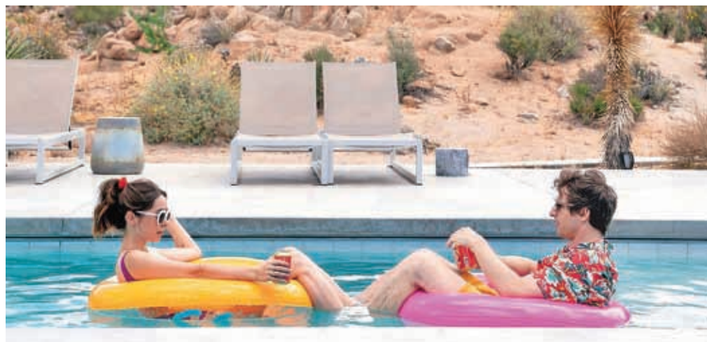
Prizor iz romantične komedije Palm Springs

Po začasni zaustavitvi javnih dogodkov in socialnega življenja se pred nami končno odpira obdobje prebujanja domišljije, sanj, umetnosti. Zato se bomo v toplih junijskih večerih srečali na kranjskih ulicah, na letnem vrtu gradu Khislstein, na tržnici in terasi Layerjeve hiše. Kranj, kot se za Prešernovo mesto spodobi, je ne nazadnje od nekdanj veljal za mesto, ki velik poudarek namenja prav kulturi: in čas je že, da v tej razvejani paleti kulturnih dejavnosti zaživita tudi film in igra. Naj (za)živi KRAFFT!