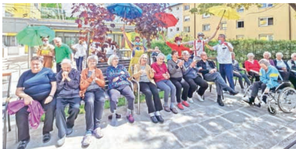
Rdeči noski so razveselili stanovalce Doma upokojencev Kranj.

upokojencev Kranj spet razveselili Rdeči noski. S pisano predstavo so priklicali nasmeha na njihove obraze in jih spodbudili tudi k lahkim telesnim vajam. Majsko dopoldne s poletnimi temperaturami je omogočilo, da so stanovalci predstavo spremljali na vrtu.