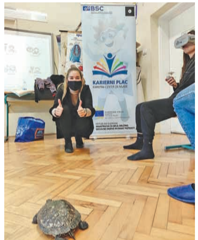
Včasih nas na delavnicah obiščejo tudi nekoliko nevsakdanji gostje.

ni plac – Karierni center za mlade so za obiskovalce brezplačne, saj projekt sofinancirata Ministrstvo za delo, družino, socialne zadeve in enake možnosti in Evropska unija iz Evropskega socialnega sklada.