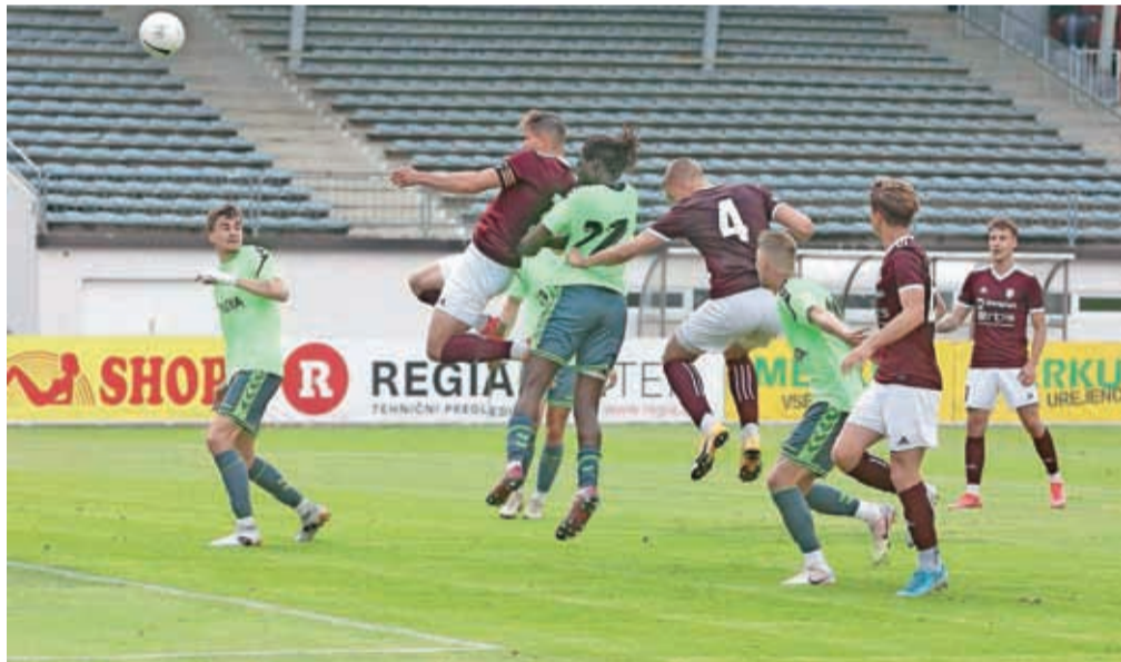
Nogometaši Triglava (v bordo dresih) so za konec sezone premagali Krko.