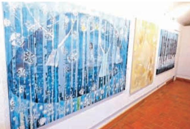
V Mali galeriji so na ogled dela iz cikla Utešanje divjine.