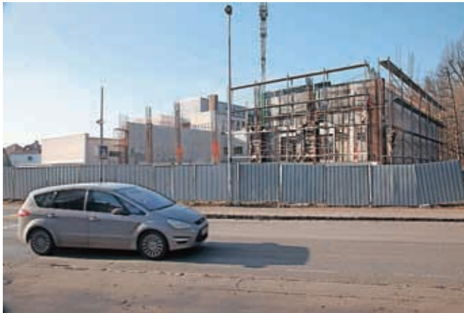
Prizidek k Osnovni šoli Staneta Žagarja bodo dokončali do jeseni.

energetske sanacije občinskih stavb in gradnjo kolesarskih povezav, 1,5 milijona evrov bodo namenili urbani prenovi Kranja. Na območju širitve Poslovne cone Hrastje bodo gradili novo javno infrastrukturo, letošnja dela bodo vredna okoli pet milijonov evrov. Nadaljevali bodo komunalno urejanje Industrijske cone Laze (909 tisoč evrov v dveh letih), komunalno infrastrukturo pa bodo začeli graditi tudi na relacijah Golnik–Mlaka (3,81 milijona evrov v dveh letih) in Goreinja Sava–Rakovica–Zabukovje–Spodnja Besnica in Zgornja Besnica (5,67 milijona evrov v treh letih). Za letos načrtujejo začetek rekonstrukcije Savske ceste z izgradnjo novega mostu