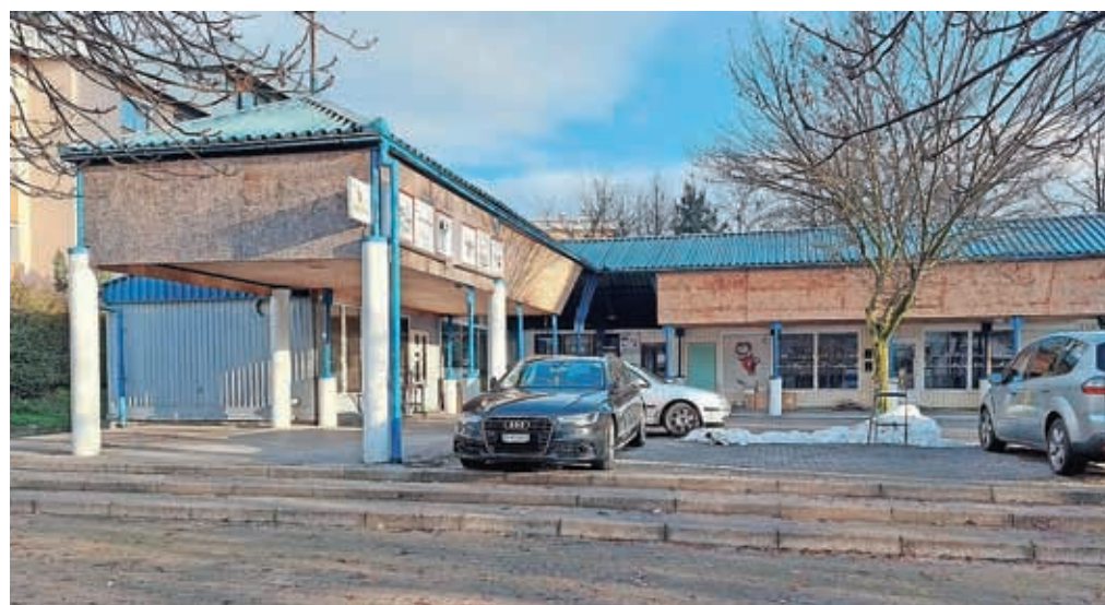
Kioske bodo odstranili in uredili parkirna mesta.

časa poteklo, da so najemniki dejstvo o spremembi sprejeli. "S sedmimi nekdanjimi najemniki je tako že bil dosežen sporazum za odstranitev kioskov, s tremi pa še ne," so razložili. Prva dela se bodo začela v začetku februarja. MOK namerava na zemljišču nekdanje mini tržnice v prvi fazi urediti pešeno parkirišče z okoli trideset parkirnimi mesti in pripadajočo urbano krajinsko ureditvijo. S tem želi v kratkem času omiliti pomanjkanje parkirnih mest v najbolj poseljeni soseski v mestu. Za naprej pa bodo iskali trajne in dolgoročne rešitve, ki bodo na tej lokaciji izboljšale kakovost bivanja, ne samo v smislu zagotavljanja parkirnih mest, ampak tudi širše (sociološki, trajnostni vidiki ipd.), so razložili.