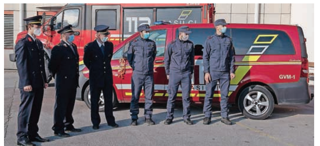
Gasilci PGD Jošt so v uporabo prevzeli operativno vozilo GVV-1 in moštveno vozilo GVM-1.