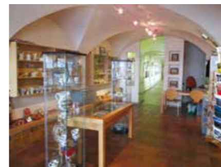
Kje, kam, kako ... vam na TIC-u povedo.

Ta je izdelal tudi načrte za arkade in vodnjak ob Rožnovski cerkvi, ki stoji ob poti proti Pungertu. Tu stoji edini v celoti ohranjeni srednjeveški obrambni stolp iz 16. stoletja, kot se je ohranil po poznejših prezidavah, ko je služil za mestno ječo (1832) in pozneje celo za stanovanje. Ječo tu je izkusil tudi znani kranjski slikar Leopold Layer, avtor znamenite podobe brezjanske Marije z Jezusom. Layer se je v ječi zaobljubil, da bo, če bo kdaj izpuščen, poslikal kapelico Matere Božje na Brezjah. Ko je leta 1814 prišel na prostost, je obljubo izpolnil in poleg ureditve kapelice naslikal še oljnato podobo Marije Pomagaj. V neposredni bližini stolpa so med kugo v 15. stoletju zgradili gotško rebasto obokano podružnično cerkev, posvečeno zaščitnikom pred smrtonosno boleznijo, sv. Fabijanu, sv. Sebastjanu in sv. Roku. V stolpu danes potekajo predvsem delavnice in prireditve za otroke, tu je zanje pravi