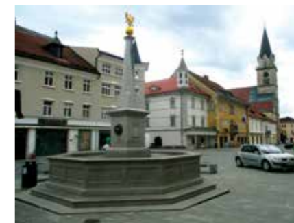
Glavni trg z vodnjakom, mestno hišo in cerkvijo.