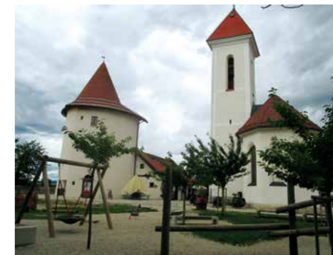
Pungert na koncu mesta - priljubljeno zbirališče Kranjčanov.