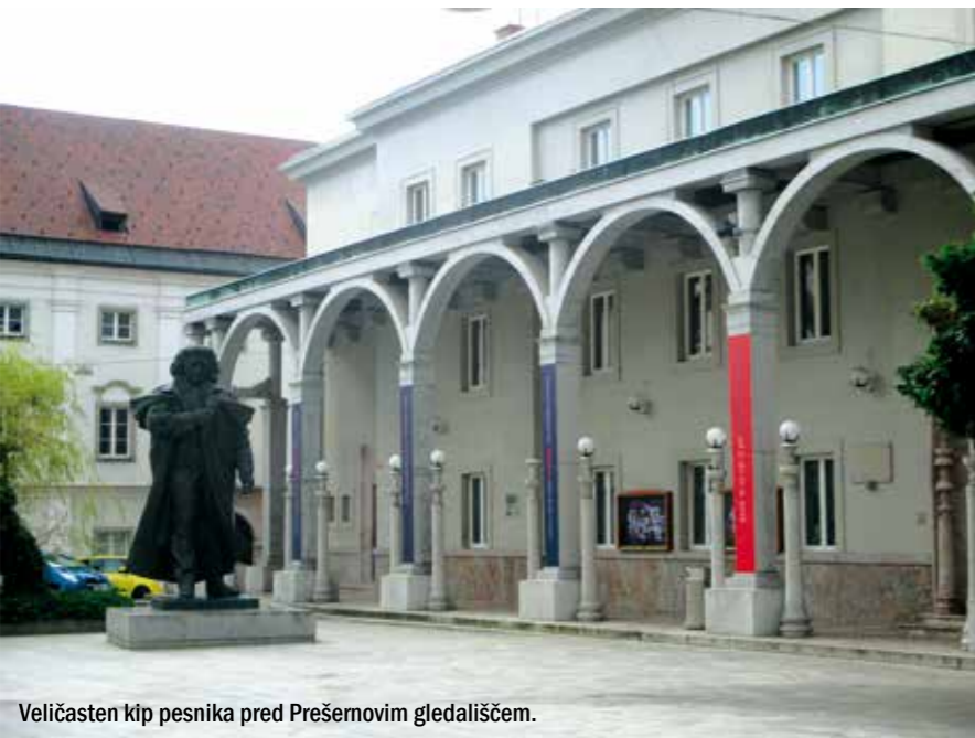
Veličasten kip pesnika pred Prešernovim gledališčem.