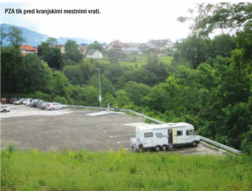
PZA tik pred kranjskimi mestnimi vrati.