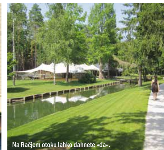
Na Račjem otoku lahko dahnete »da«.

Za vstop v rove je potrebno kupiti vstopnico na Zavodu za turizem in kulturo Kranj na Glavnem trgu. Do konca letošnjega septembra pa ob petkih in sobotah ob 17. uri ogled rogov lahko združite z ogledom mesta in razstave Banksy v Layerjevi hiši v paketu vodnega ogleda, imenovanem Pocestnica.