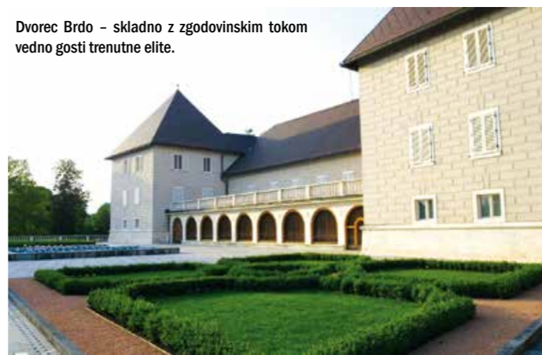
Dvorec Brdo - skladno z zgodovinskim tokom vedno gosti trenutne elite.