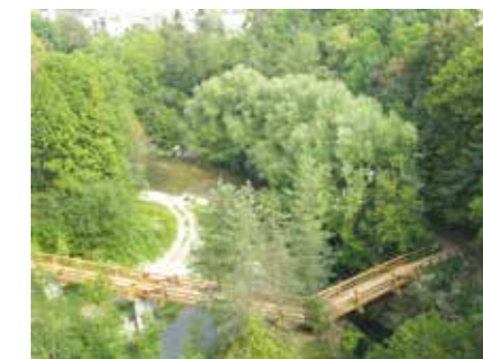
Pogled na kanjon reke Kokre.