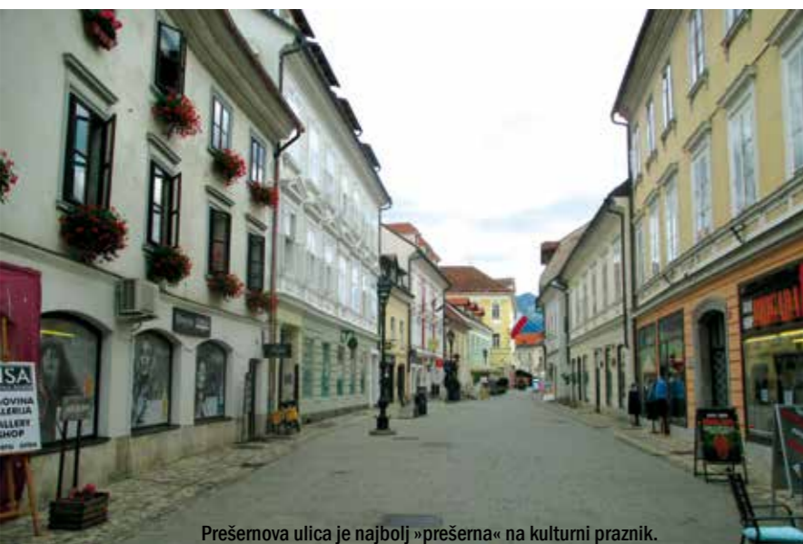
Prešernova ulica je najbolj »prešerna« na kulturni praznik.

Z a avtodomarje je zgodovinskega pomena tudi junijska otvoritev novega parkirišča in obenemčasnega postajališča za avtodome. Z novimi koordinatami na zemljevidu ne tuji ne domači turisti ne bodo leteli po avtocesti mimo Kranja, samo pet minut namreč loči popotnika, da postane tako rekoč pred mestnimi vrati. Staro cesto pa tudi vsi še dobro poznamo iz časov, ko smo redno potovali skozi Kranj v Avstrijo.