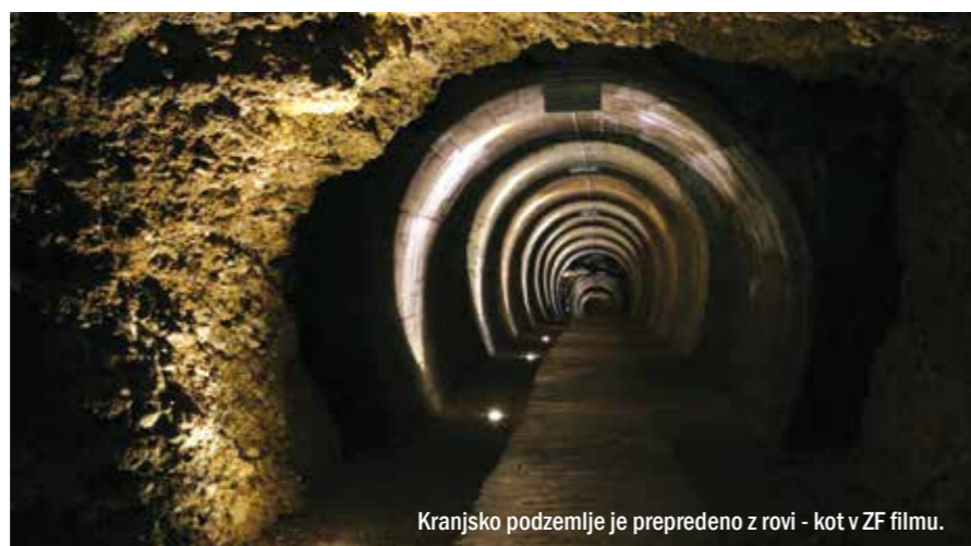
Kranjsko podzemlje je preprejeno z rovi - kot v ZF filmu.