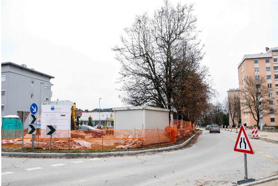
Umeščnost novega Centra trajnostne mobilnosti v soseski Planina

EVROPSKA UNIJA EVROPSKI SKLAD ZA REGIONALNI RAZVOJ NALOŽBA V VAŠO PRIHODNOST