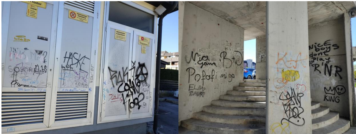
Trafopostaja Elektro in stopnišče, Ulica Rudija Papeža, vzhodno od trgovine Spar