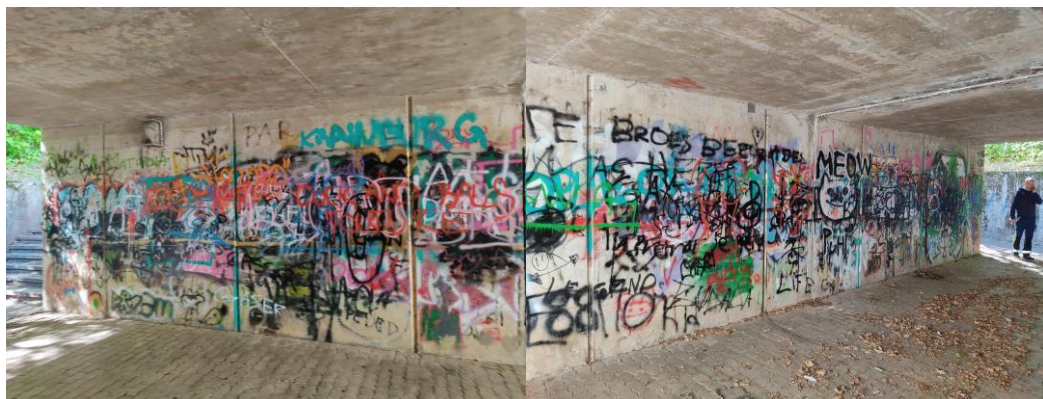
Cesta 1. maja – podhod pri OŠ Staneta Žagarja proti gozdčku