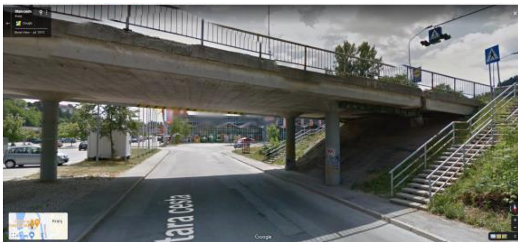
Supernova Kranj Savski otok – podvoz in stopnišče