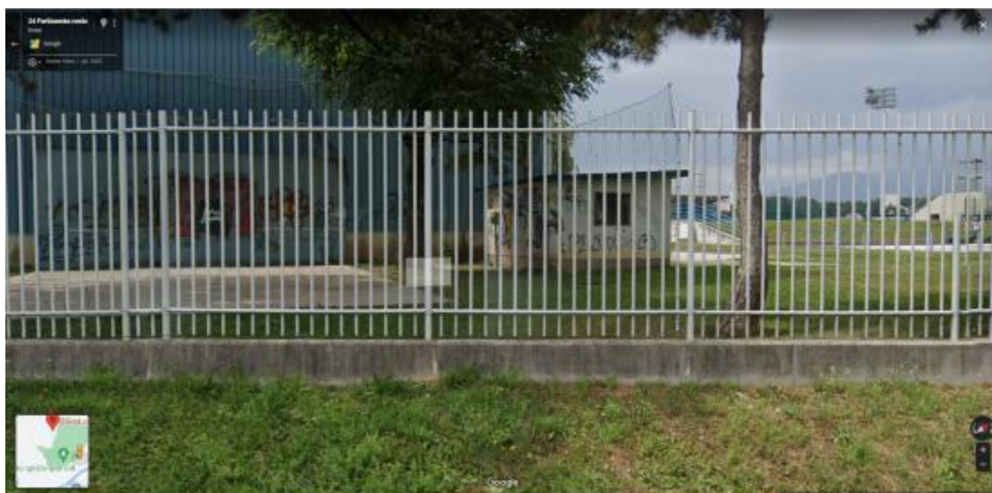
Bazen – športni center (skatepark, obstoječe rampe, zid za tenis in majhna hiška)