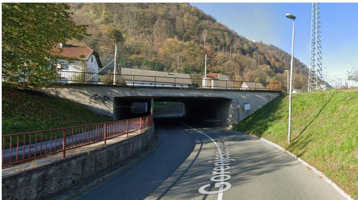
Cesta Kranj-Besnica – podhod pod železniško progo