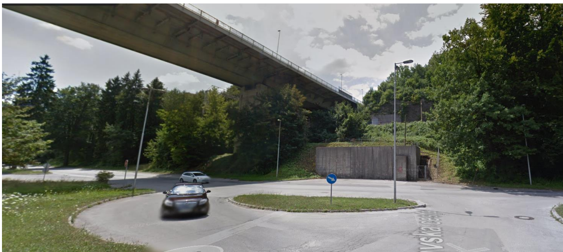
Betonski infrastrukturni objekt pod Delavskim mostom, Savska Loka