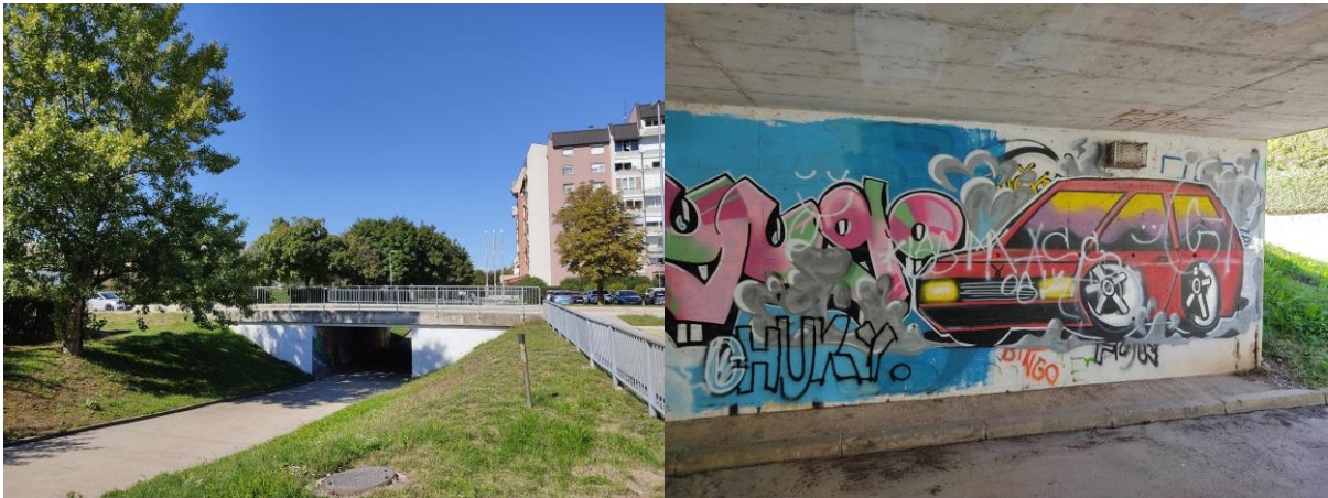
Cesta Jaka Platiše – podhod, Planina 2