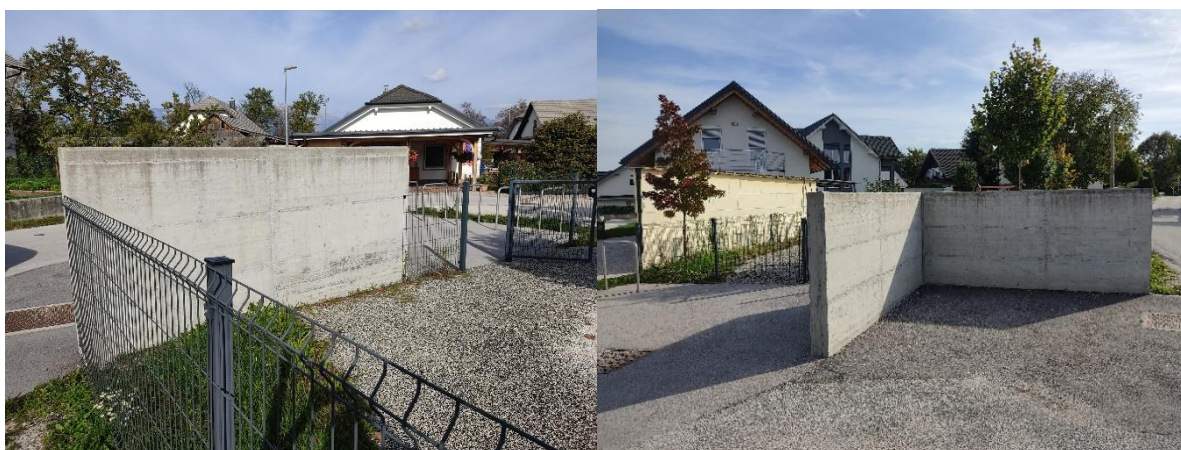
Stara Drulovka – zidec pri otroškem igrišču, Zasavska cesta 38 c