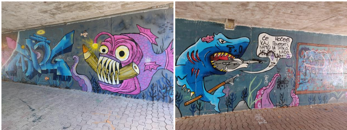
Cesta talcev – podhod, nekdanja cvetličarna Flora