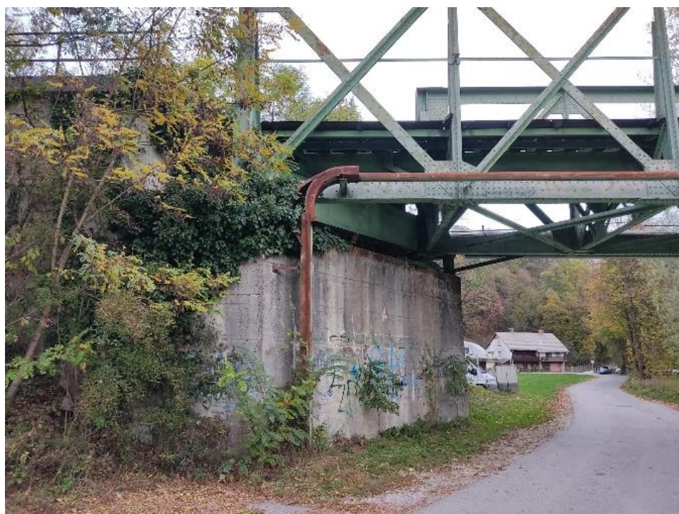
Stena pod železniškim mostom