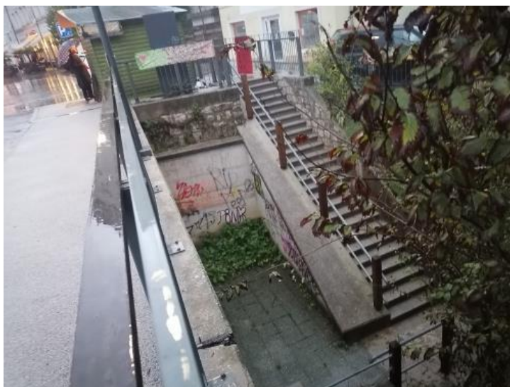
Stena pod Kokrškim mostom na Poštni ulici (na vrhu stopnic za kanjon)