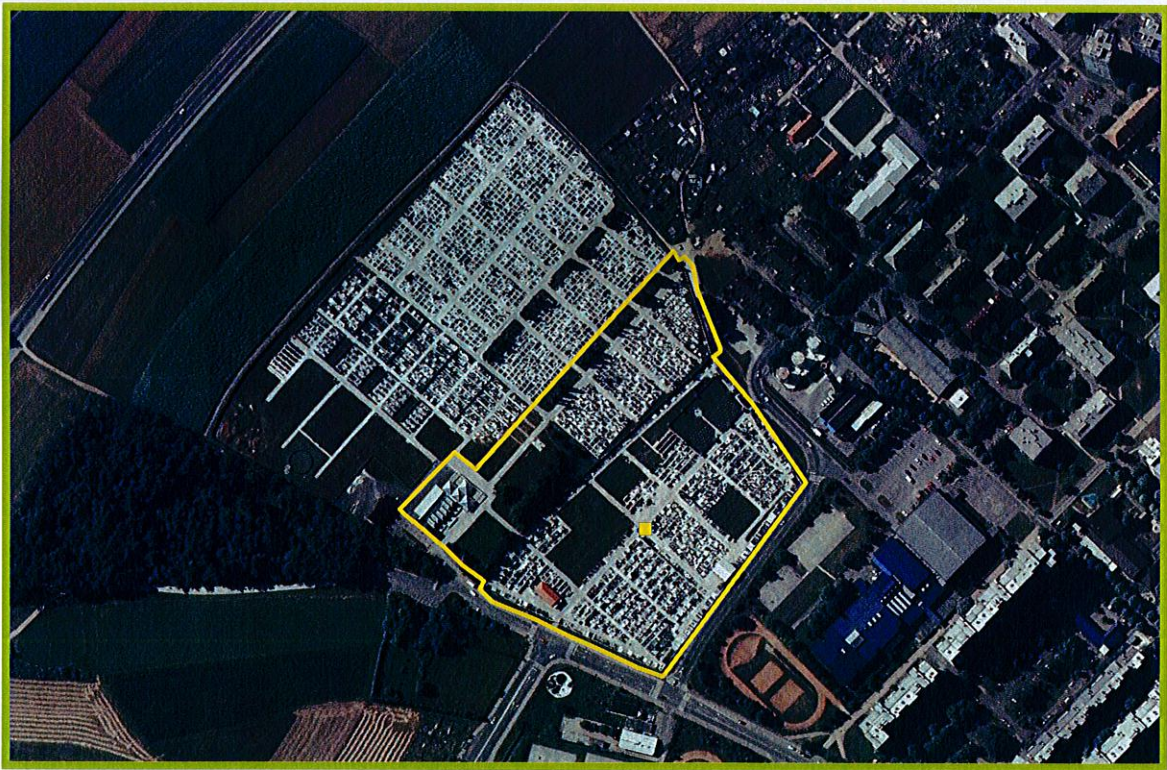
VIR: Gis MK