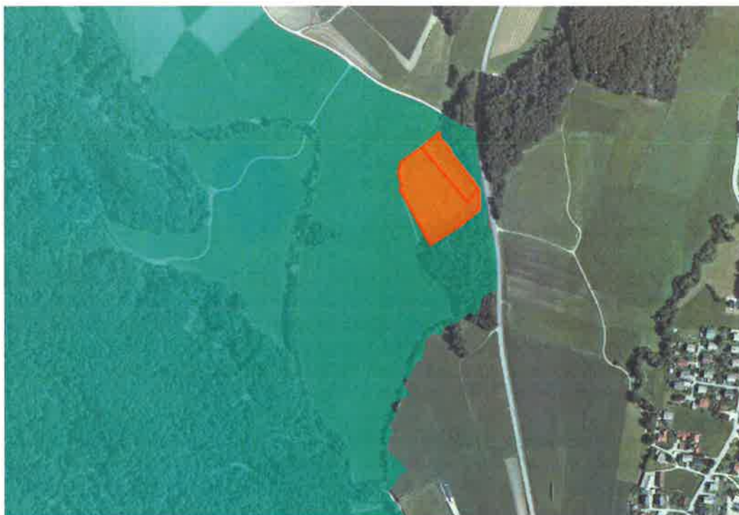
Slika 2: Prikaz nove lokacije kmetijskega gospodarstva Logar (oranžna barva). Z zeleno barvo je označeno območje Spominskega parka Udin boršt.

Kot najprimernejša rešitev se je izkazala lokacija Glina na območju parcel št. 347-1 in 347/2 k.o. Goriče, kateri pa se že nahajata na robu obstoječega Spominskega parka Udin boršt. Zaradi tega smo za izdelavo smernic glede območja in režima varstva zaprosili Zavod Republike Slovenije za varstvo narave in Zavod Republike Slovenije za varstvo kulturne dediščine.