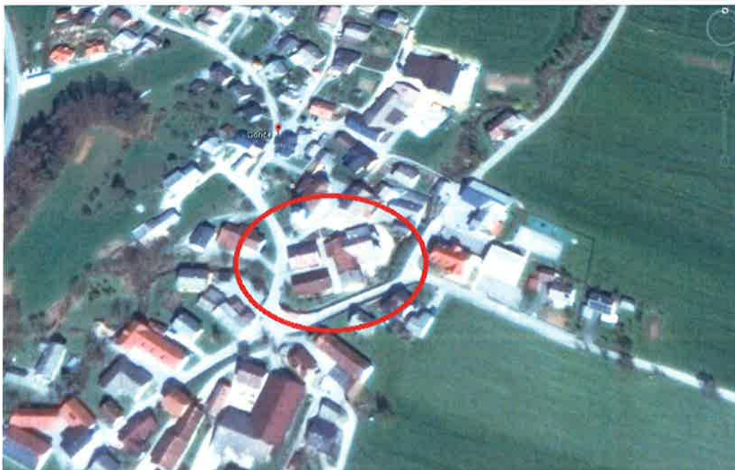
Slika 1: Lokacija kmetijskega gospodarstva Logar v vasi Goriče

V strogem središču vasi Goriče pa se nahaja tudi Kmetijsko gospodarstvo Logar, kjer ga na severu omejuje območje župne cerkve sv. Andreja, objekt krajevne skupnosti in sosednje kmetijsko gospodarstvo, na vseh ostalih straneh je omejeno z lokalno cestno infrastrukturo, kjer nima prostora za širjenje in uvajanje sodobnih tehnoloških postopkov na tej lokaciji, zato so lastniki v letu 2016 sprožili ustrezne postopke za pridobitev dokumentacije za selitev kmetijskega gospodarstva iz vasi.