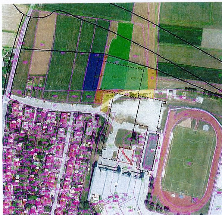
Slika 1: Ortofoto posnetek območja predvidenih del

Mestna občina Kranj je pridobila Idejno zasnovo za gradnjo oz. postavitve Ledne dvorane v Kranju. Lokacija predvidenih del je na parcelnih številkah 270/1, 271/1, 272/1, 271/3, 275/1, 347/2, vse k.o. Rupa v Kranju.