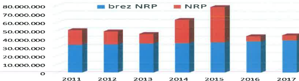
Izdatki z NRP in brez NRP v obdobju 2011-2017