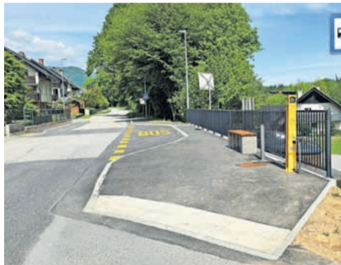
Novo avtobusno postajališče v Novi vasi v Zgornji Besnici

KS Besnica je za investicijo namenila 20 tisoč evrov na podlagi 8. člena odloka o financiranju krajevnih skupnosti v mestni občini Kranj, je razložil Bavdek. V okviru participativnega proračuna pa so v KS Besnica na podlagi glasovanja krajanov nazadnje poskrbeli za projektiranje pločnika na odseku od naslova Na Vidmu 14 do Nove vasi 45. »V letu 2026 smo tudi že uredili približno 65 metrov nove ceste v Zabukovju. Investicija je stala 30 tisoč evrov, za asfalt je primaknila Mestna občina Kranj,« je še povedal Bavdek.