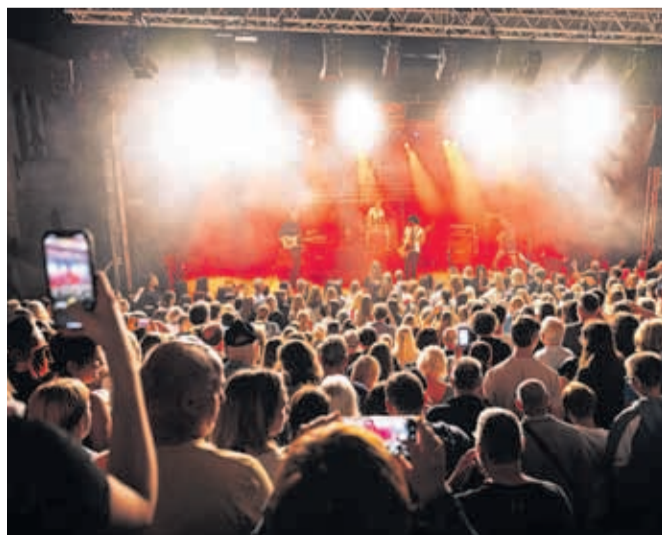
Kranfest na številnih mestnih prizoriščih ponuja kulturne dogodke in zabavni program, koncertne poslastice in kulinarična doživetja ter vodene ogleda. Lansko leto je v času festivala na odru Letnega gledališča Khislstein občinstvo navdušil Plavi orkestar, letos bodo nastopili zasedbi Kokosy in Koala voice (24. 7.) ter Ansambel Saša Avsenika (25. 7.).

Kranj – Začeli smo z gastronomijo. Festival Okusi Kranjskih miz (8.–24. 5.) se je predstavil na Glavnem trgu. Letos je sodelovalo 20 restavracij iz šestih gorenjskih občin. Glavni trg z 29. majem odpira tudi sezono družabno-kulinaričnih petkovih popoldnevov, nato pa bo Kr'petek je! potekal 13 petkov v tem poletju. Julija bo Glavni trg gostil Karavano okusov (24.–25. 7.), septembra pa Praznik piva in kranjske klobase (11.–12. 9.). Veliki gastronomski finale pa je Kranjska dolga miza, zeleni kulinarični dogodek na vrtu gradu Khislstein (3. 9.). Grad Khislstein tudi letos ostaja osrednje poletno prizorišče v Kranju pod okri-