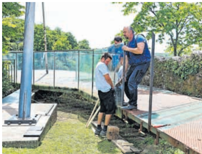
Na razgledni ploščadi na Pungertu potekajo obnovitvena dela.

Kranj – Mestna občina Kranj je začela obnovitvena dela na razgledni ploščadi na Pungertu, ki je zaradi različnih poškodb zaprta od novembra 2024. Za sanacijo bodo namenili dobrih 139 tisoč evrov, razgledna ploščad na koncu starega dela Kranja pa bo predvidoma ponovno odprta septembra. Razgledno ploščad so zaprli pred poldrugim letom, ker je zaradi vandalizma popokala steklena ograja, lanski strokovni pregled stanja ploščadi, ki ga je opravil Inštitut za metalne konstrukcije, pa