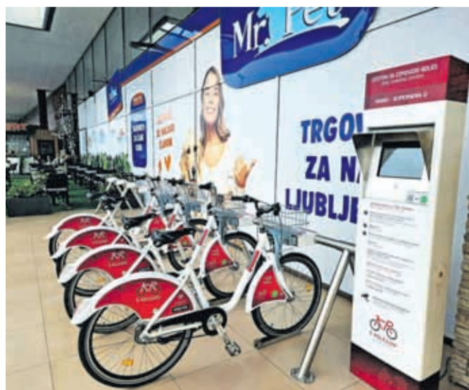
Postaja KRskolesom v Supernovi Kranj

Kranj – Mestna občina Kranj je v Supernovi Kranj (nekdanja Qlandia) odprla novo postajo sistema za izposajo koles KRskolesom z devetimi ključavnicami. Gre že za 32. postajo KRskolesom, do konca leta 2027 načrtujejo še devet novih, v sistemu pa je trenutno na voljo približno 200 koles. V letu 2025 so uporabniki opravili približno 80.000 izposoj, število registriranih uporabnikov pa se približuje številu 1.600. Sistem KRskolesom je sicer povezan v regijski sistem Gorenjska bike in ostaja osrednji gradnik trajnostne mobilnosti v Kranju in zelene prihodnosti regije. S. Š.