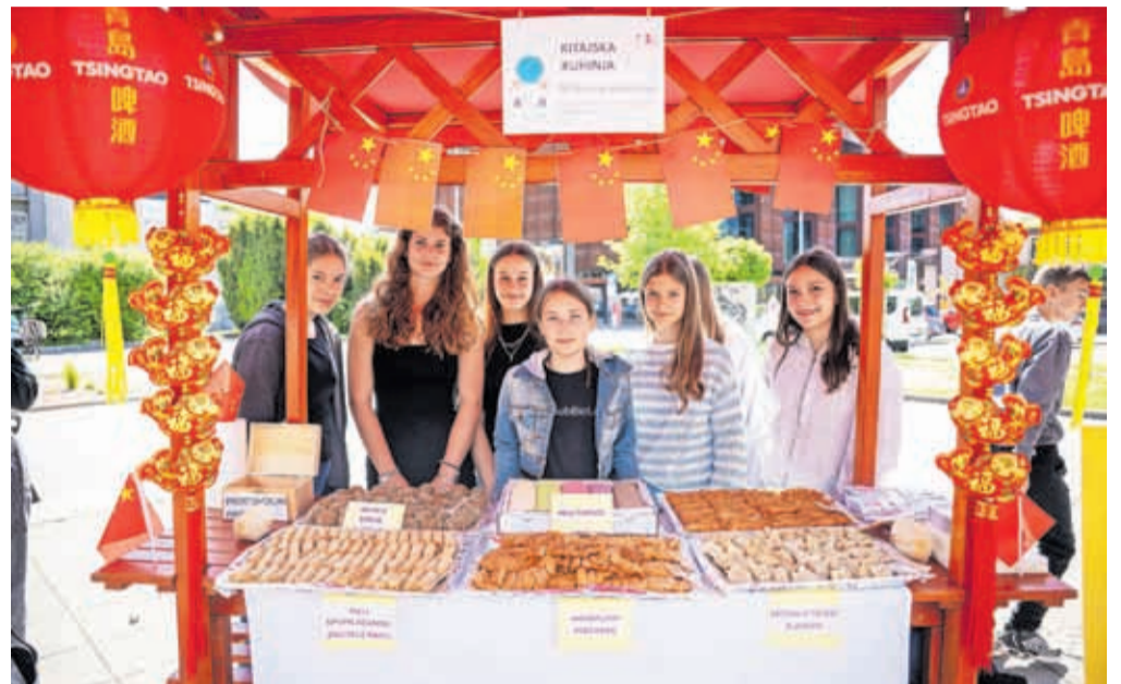
Različne kitajske jedi so obiskovalcem ponudili učenci iz Osnovne šole Simona Jenka.