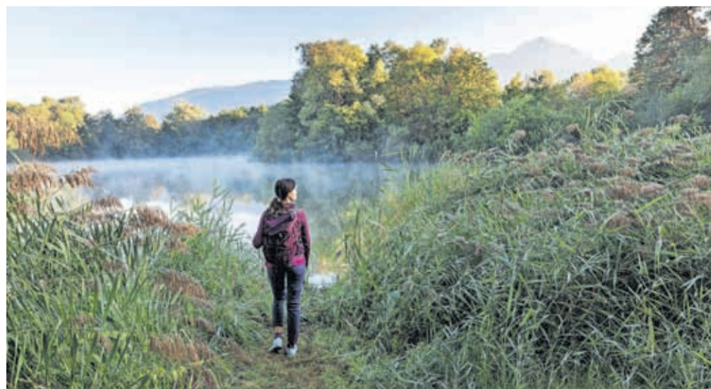
Kranj obdaja čudovita narava.

jezerca, ki so zaradi svoje naravne raznolikosti zaščitena kot naravni spomenik. Tam boste tako lahko opazili številne rastlinske vrste, ptice, kačje pastirje, žabe in še marsikaj. Krožna sprehajalna Pot pod Storžičem, ki vas popelje po kraljestvu mogočnega dvatisočaka, se začne nad vasjo Povelje, nadaljuje na sv. Lovrencu, kjer boste našli eno najstarejših cerkva na tem območju, spusti do Doma na Lovrencu, ker se lahko ustavite na svežih krofih in drugih domačih dobrotah, in vas preko Babnega Vrta pripelje nazaj na Povelje. Vsekakor pa ne moremo govoriti o kranjskem podeželju, ne da bi omenili hišni hrib Kranjčank in Kranjčanov – Sveti Jošt nad Kranjem. Njegova priljubljenost ne preseneča, saj predstavlja odlično priložnost za rekreacijo, pobeg v naravo in uživanje v čudovitem razgledu ter okusni hrani.