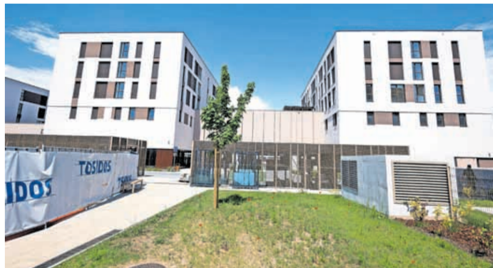
Stanovanja, prilagojena starejšim, so del nove soseske Kranjska iskrica.

Stanovanja za starejše so del soseske Kranjska iskrica, kjer je investitor Emeco nepremičnine v prvi fazi zgradil sedem objektov z 269 stanovanji. Poleg 57 stanovanj za Nepremičninski sklad PIZ so preostalih 212 prodali na trgu. Investitor nadaljuje drugo fazo projekta, v kateri bo zgrajenih še 133 stanovanj.