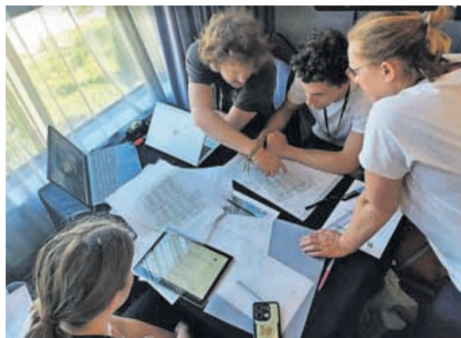
Ekipa mladih, ki je zastopala Slovenijo, je na hekatonu poudarila predvsem izziv, kako na lokaciji zadržati in uporabiti padavinsko vodo.