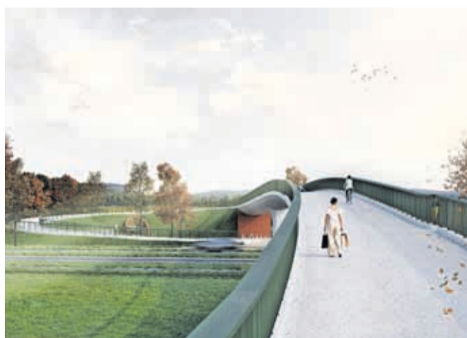
Vizualizacija nadhoda za pešce in kolesarje pri Planetu Kranj / VIR: MOK

Gre za prometno nevarno točko, saj številni sprehajalci in kolesarji tam nezakonito prečkajo cesto, opozarja župan Matjaž Rakovec. »Tako početje lahko rešujemo na dva načina. Prvi bi bil lahko, da kršitelje kaznujemo, drugi pa, da občankam in občanom pomagamo varno na drugo stran ceste. Ureditev klasičnega prehoda za pešce ni mogoča, saj je promet na tem delu regionalne ceste zelo gost. Izgradnja nadhoda