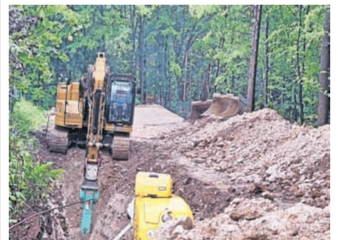
Dela bodo potekala predvidoma do leta 2028.

mogočen, razen za intervencijska vozila. Iz MOK so sporočili, da bo izvajalec po položitvi komunalnih vodovodov izkopalne jarke sproti zasipaval, da bo motenj za prebivalce čim manj, dostopnost do domov in zemljišč pa čim boljša. Dodali so, da bo izvajalec občane o začetku posameznih faz gradbenih del in prometnih ureditvah obveščal sproti. Prebivalce prosijo za potrpežljivost in strpnost med izvajanjem del. Naložba v Čirčah je del širšega projekta, vrednega približno 30 milijonov evrov, od tega ga z 9,3 milijona evrov sofinancirata država in EU. Vrednost del v Čirčah znaša 8,4 milijona