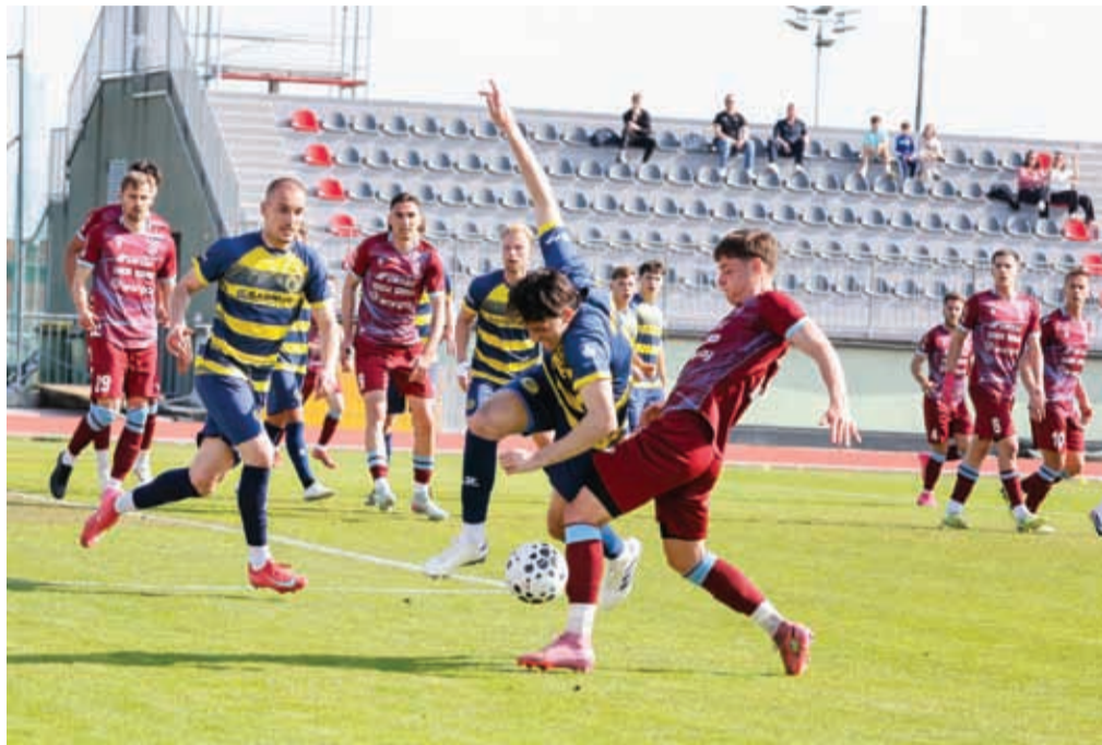
Nogometaši kranjskega Triglava (v bordo dresih) so na tridesetih tekmah v drugi ligi dosegli dvajset zmag in bili edini, ki jim je uspelo premagati prvake lige, Brinje Grosuplje.

na koncu točko manj kot letos. Za prvouvrščenima ekipama je res izjemna sezona, v kateri sta obe izgubili le enkrat, Brinje Grosu-