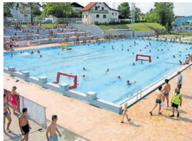
Letno kopališče v Kranju

Za Kranjčan(k)e je smotno, da CeKR pridobijo že pred odprtjem bazena na prostem in tako že od samega začetka vstopajo na kopališče po nižji ceni. CeKR lahko pridobijo v sprejemni pisarni MOK (Slovenski trg 1, Kranj), v poslovalnicah NLB in v Knjižnici Globus (Mestna knjižnica Kranj), v kratkem tudi na recepciji Olimpijskega (pokritega) bazena v Kranju. Infotočka 'CeKR' bo sicer tudi na letnem kopališču. Za naročilo CeKR za zainteresirani potrebujejo osebno izkaznico, davčno številko, e-naslov in telefonsko številko. Lahko na naročijo tudi po spletu, a potrebujejo e-identiteto za najvišjo stopnjo zaupanja.