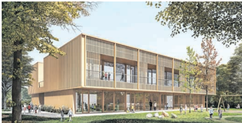
Novi vrtec Sonček bodo zgradili do leta 2028.

Na MOK so še pojasnili, da bo novogradnja skoraj ničenergijske stavbe zagotovila izboljšanje pogojev za izvajanje vzgojno-varstvenega programa, podporno, kreativno in varno okolje za otro-