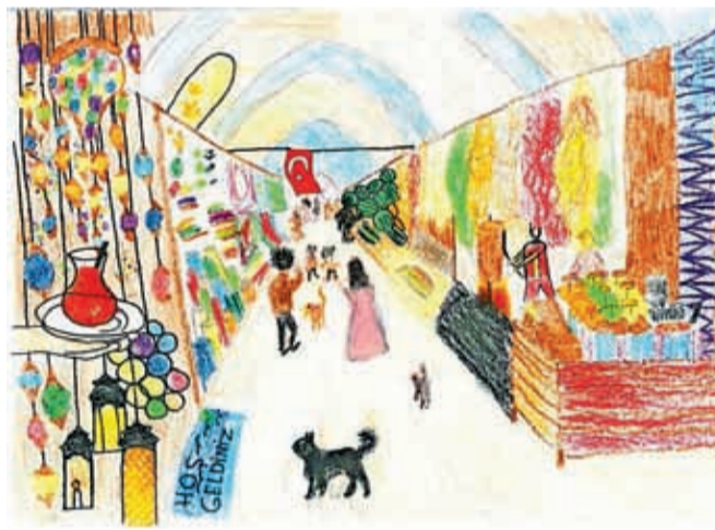
Zmagovalna risba turškega bazarja

šala, če bi sodeloval, saj je najlažje narisati nekaj, kar vidiš v živo. Takoj je predlagal, da bi narisal turški bazar, ker najbolj prikazuje turško kulturo in življenje. Hitro sva tudi izbrala, katero likovno tehniko oziroma likovne materiale bo uporabil. Odločil se je za barvice oziroma voščenke.