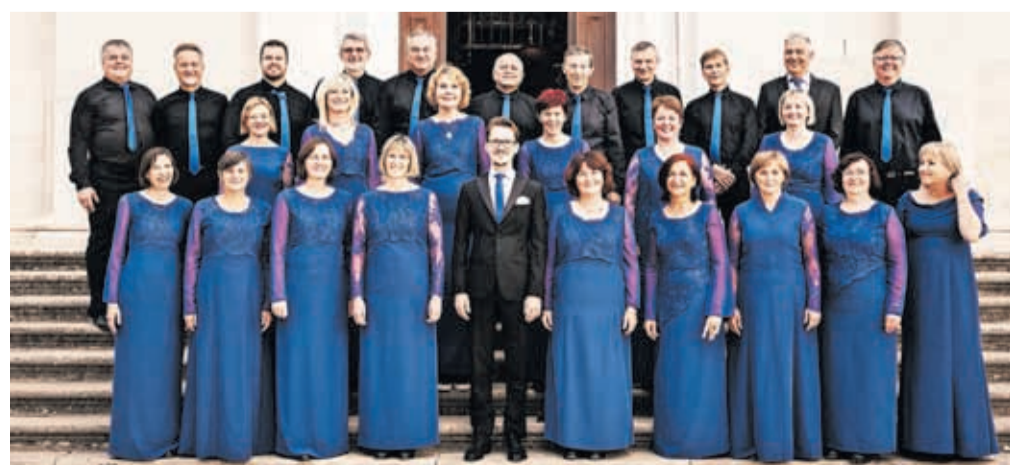
Mešani pevski zbor Musica viva neprekinjeno deluje že osem desetletij.

jo in bo na sporedu v soboto, 6. junija, ob 19.30 v matični dvorani Doma krajanov Primskovo, bo sestavljen iz priljubljenih pesmi vsakokratne generacije po posameznih desetletjih delovanja zbora. Na sporedu bodo tako slovenske ljudske kot znane skladbe iz tuje glasbene literature – kot pravijo v zboru, za vsakogar nekaj. Slišali bomo od znanih slovenskih ljudskih Dajte dajte, Pa se sliš' do tujih pesmi, kot sta What a wonderful world in Shennandoah in znane Na lepi modri Donavi in druge. Pevke in pevci Mešanega pevskega zbora Musica viva pod vodstvom Jana Gorjanca Danisa vabijo, da se povežejo s pesmijo. Vstop je prost.