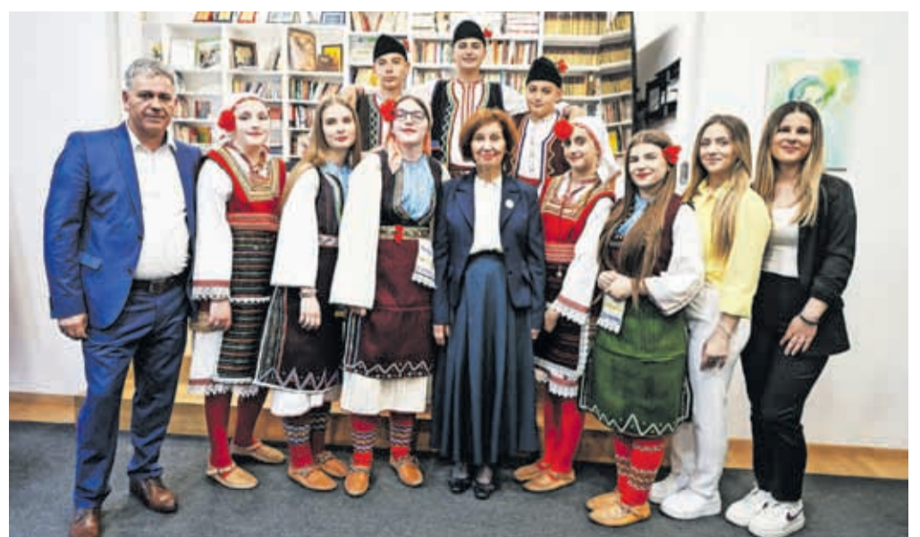
Odprtja 34. Dnevo sv. Cirila in Metoda se je udeležila tudi predsednica Republike Severne Makedonije Gordana Siljanovska-Davkova.

Slovesni večer je bil prežet tudi z umetnostjo. Na ogled je bila razstava akademske