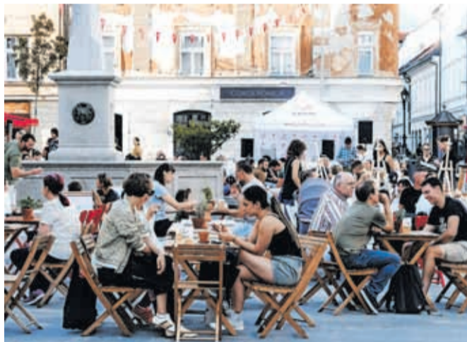
Prireditve Kr' petek je! lahko letos v Kranju pričakujemo dvanajstkrat.

kot profesionalci, saj bo delavnica akrobatskega zabijanja potekala pod vodstvom izjemnih Dunking Devils. V sredini junija bo dogajanje popestrila modna revija trgovin mestnega jedra. Konec junija in začetek julija v goste prihaja Ana Desetnica, ki vedno poskrbi za ognjeno popestritev. Da bo vedno poskrbljeno tudi za zanimivo otroško dogajanje, bo skrbel otroški kotiček pod vodstvom Gorenjskega muzeja in Kovačnice. V sezoni 2026 se dogodku pridružijo novi DJ-ji ter ponudniki hrane in pijače. Prireditve Kr' petek je! bodo na Glavnem trgu potekale: 5. 6., 12. 6., 19. 6., 26. 6., 3. 7., 10. 7., 17. 7., 7. 8., 14. 8., 21. 8., 28. 8. in 4. 9. 2026 od 17. do 22. ure.