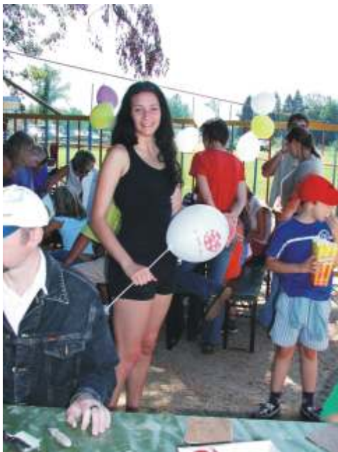
Voditeljica otroškega krožka v vlogi mažuretko.