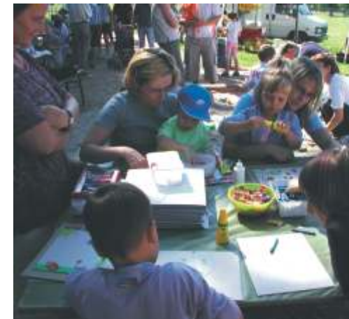
V likovni delavnici so se izkazale vse tri generacije.