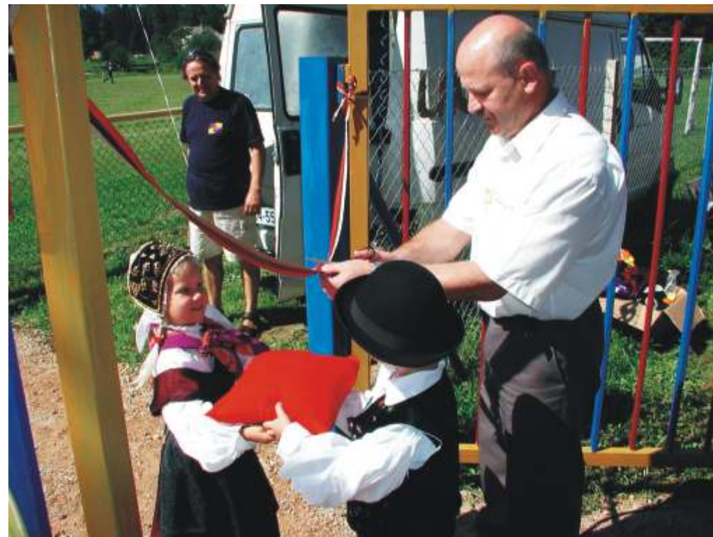
Uradna otvoritev novega otroškega igrišča DIRENDAJ.