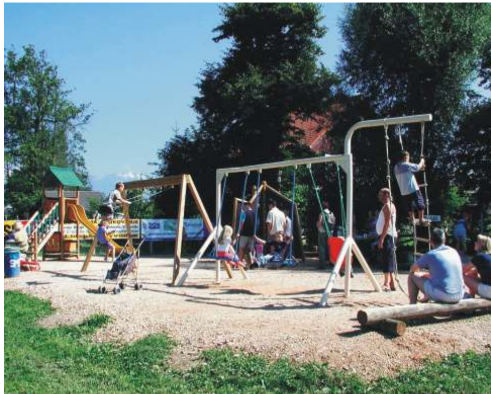
In igrišču smo prepustili mladim in tudi malo manj mladim. Pazimo nanj, da bo ostal nepoškodovan in ist.