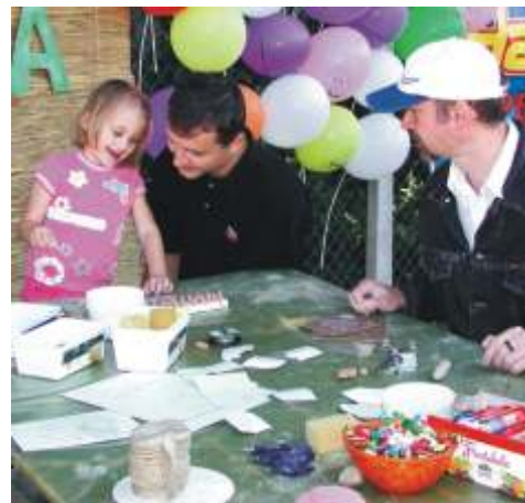
Lon ar Bojan je prenašal skrivnosti glin e na najmlajše.