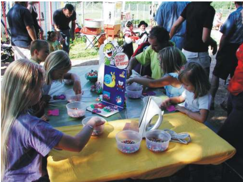
S izdelki Hama smo se izkazali, da spretne prstke imamo.