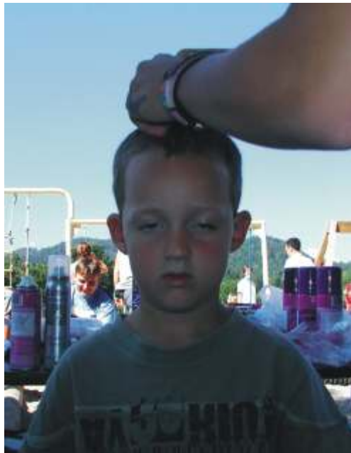
Uboge mamice, ki hodijo k frizerju. One šele trpijo!