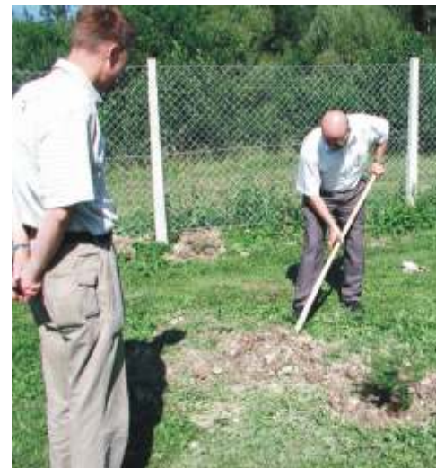
Teorija se kaže v praksi. Poslanci gledajo, predsedniki delajo.