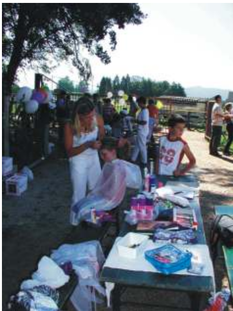
Za prireditev smo se seveda tudi polepšali.