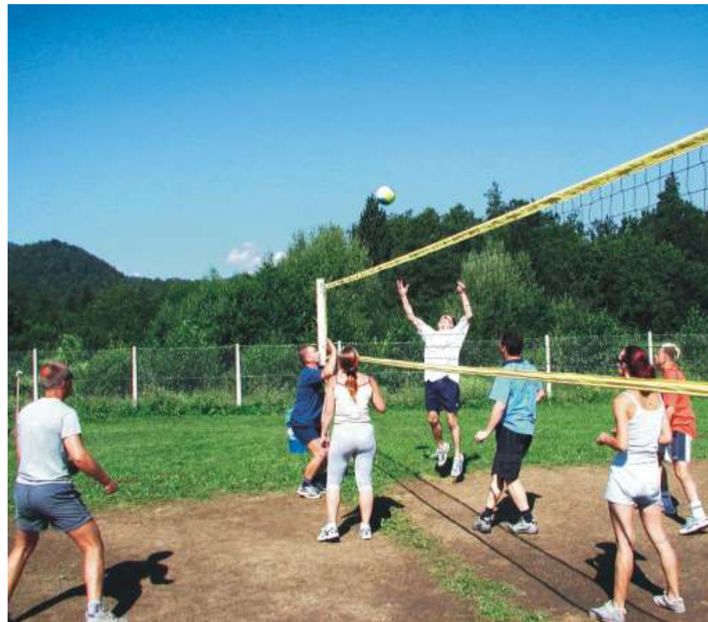
Kako visoka mreža! Ko bi vsaj prou ke imeli s seboj.