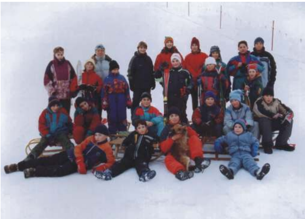
Še ena gasilska s smu iš a v Besnici

V društvu je za delo z mladimi gasilci zadolženih 7 mentorjev, ki poskrbimo, da našim najmlajšim in tudi tistim, malo manj mladim, ni nikoli dolgčas. Razne aktivnosti potekajo skozi vse leto, odvisne pa so od letnega časa.