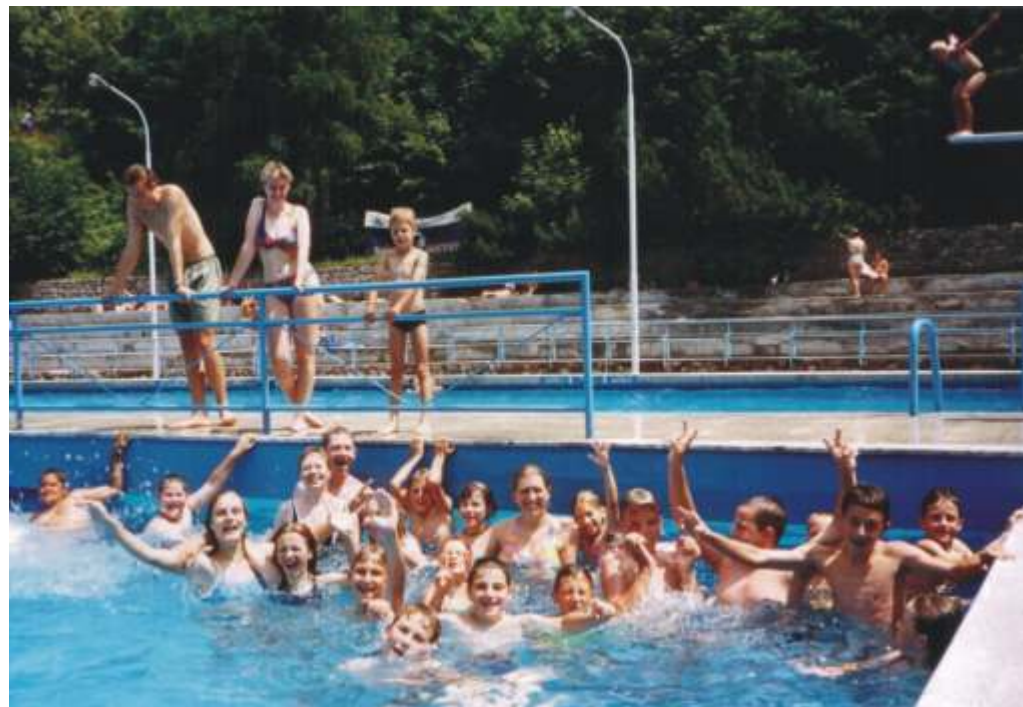
Ohladili smo se v tržiškem bazenu