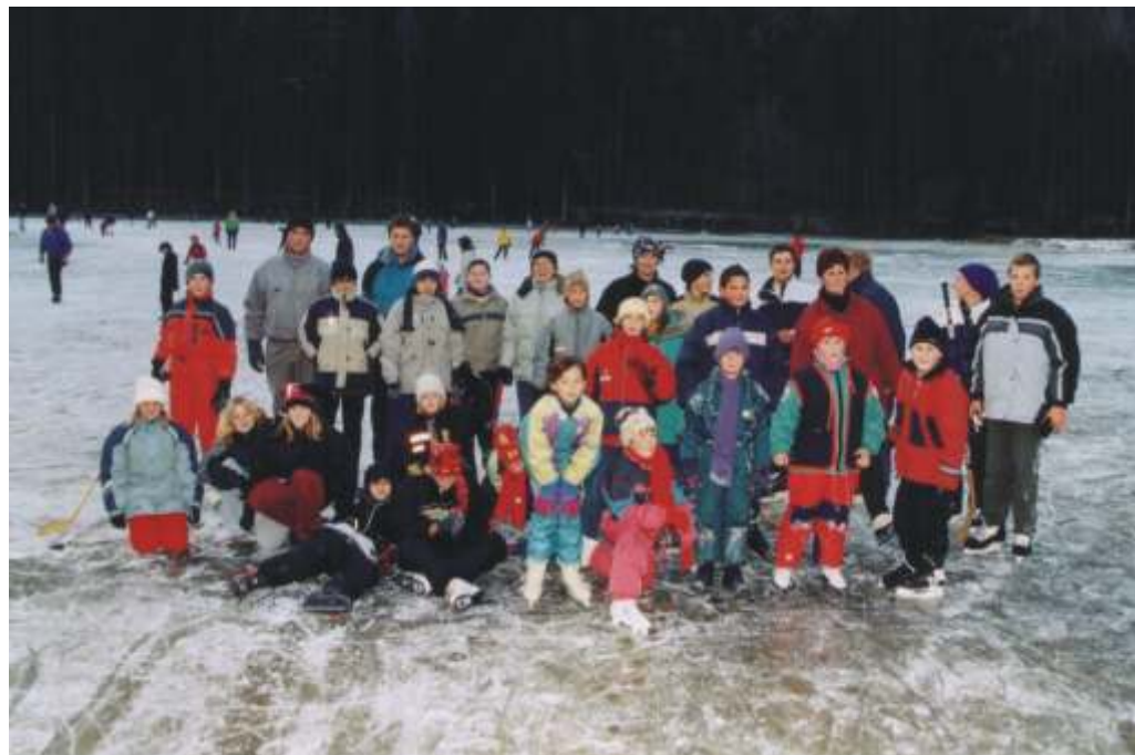
Na Jezerskem smo preizkusili nabrušene drsalke