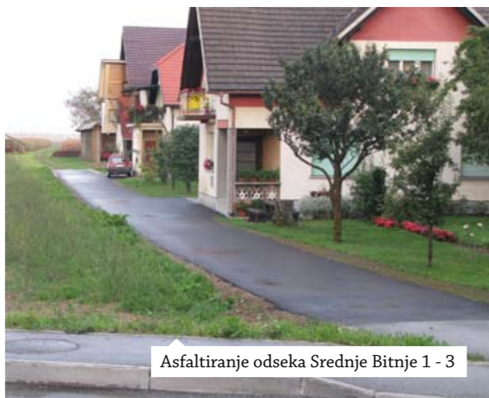
Asfaltiranje odseka Srednje Bitnje 1 - 3