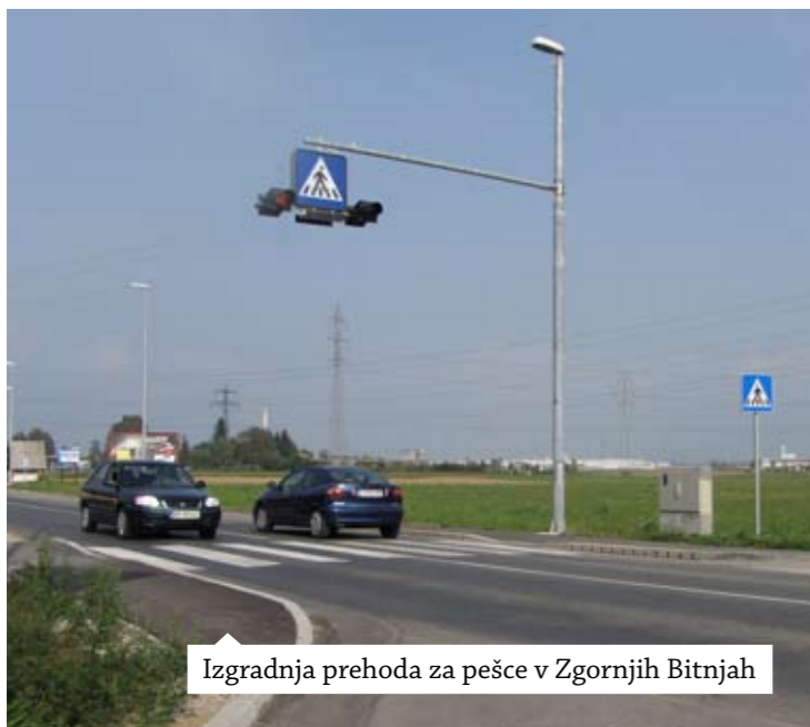
Izgradnja prehoda za pešce v Zgornjih Bitnjah