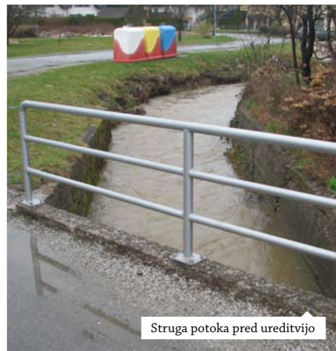
Struga potoka pred ureditvijo