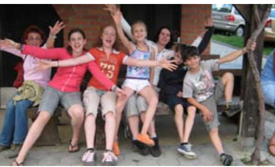
Na Puhanovi kmetiji.