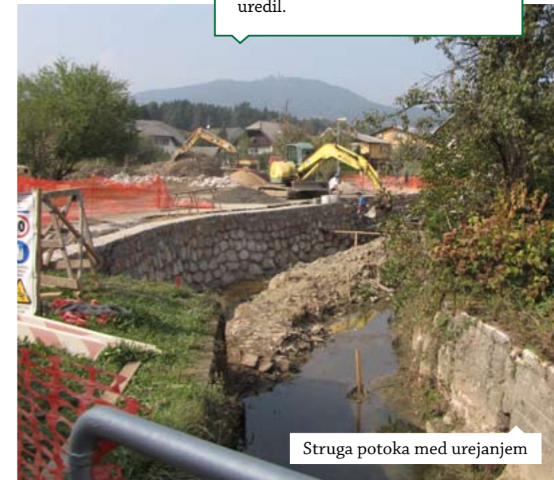
Struga potoka med urejanjem