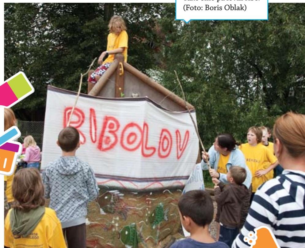
Tako smo pa lovili ribe.