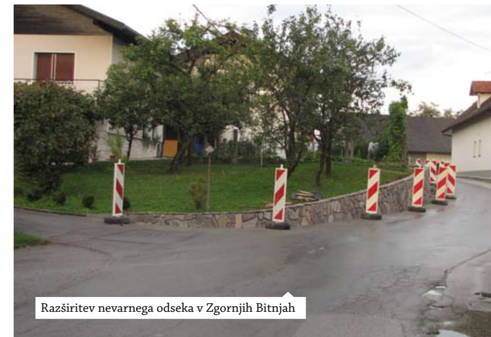
Razširitev nevarnega odseka v Zgornjih Bitnjah

Uradne ure sveta KS Bitnje so vsak četrtek v prostorih KS Bitnje v GD