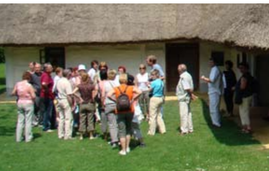
Pred staro prekmursko hišo.