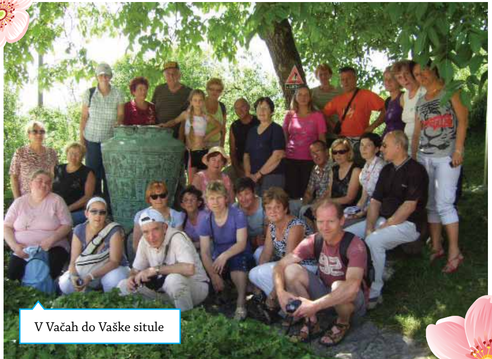
V Vačah do Vaške situle