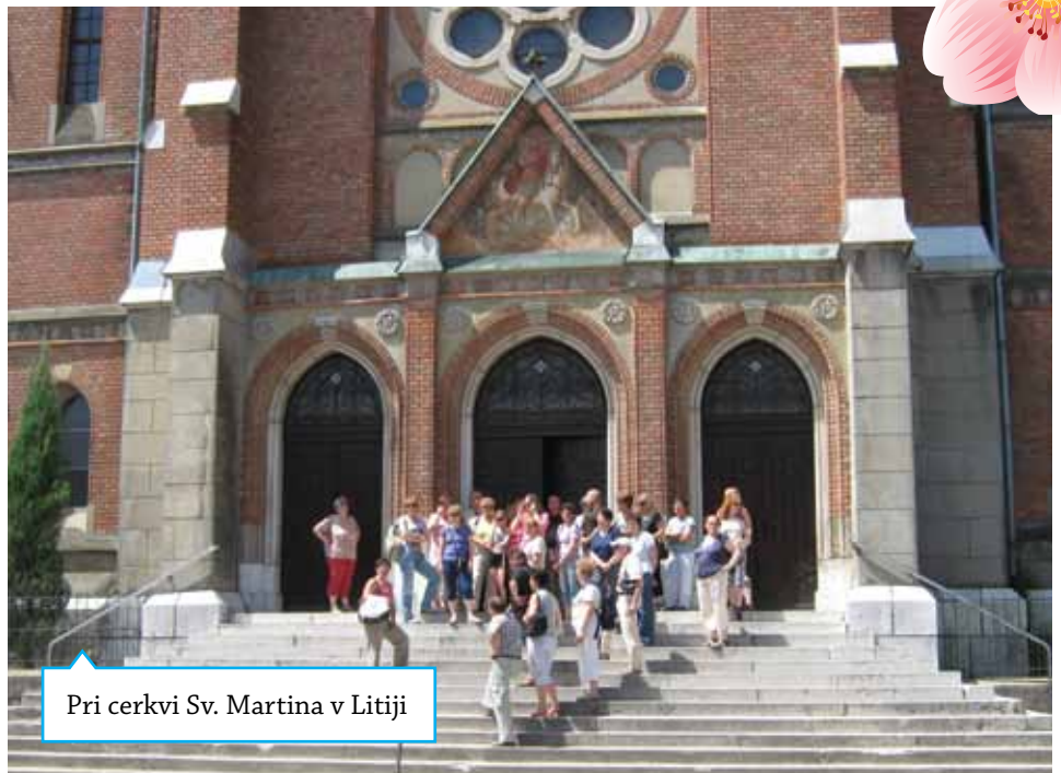
Pri cerkvi Sv. Martina v Litiji