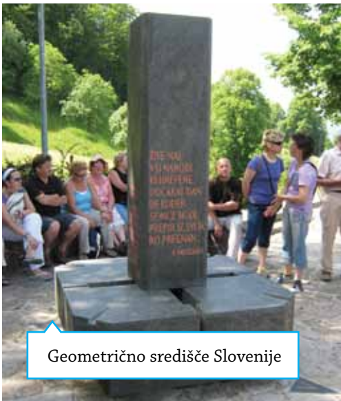
Geometrično središče Slovenije