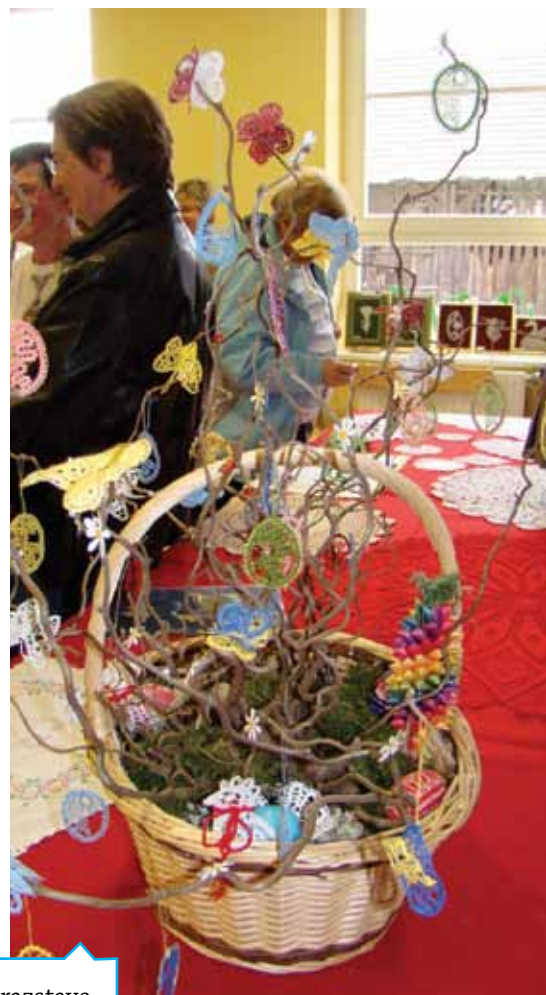
Utrinki z razstave