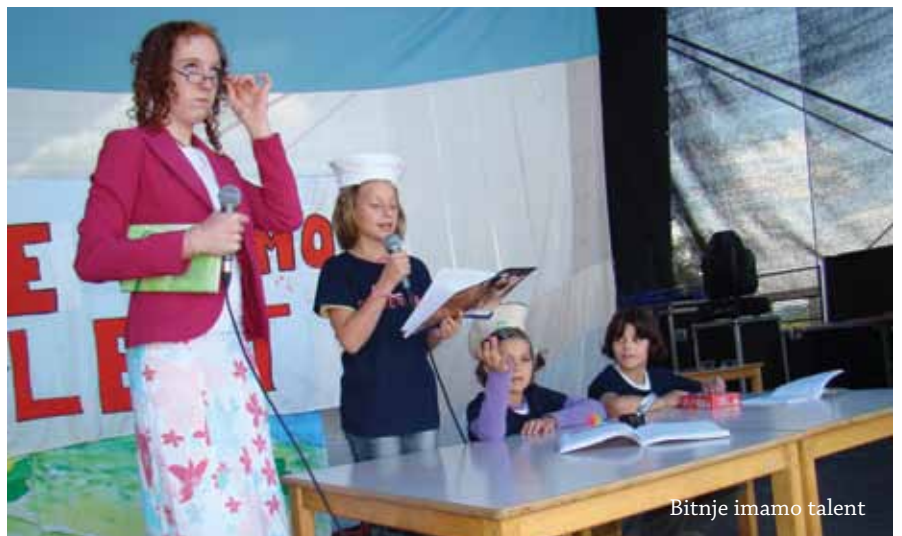
Bitnje imamo talent