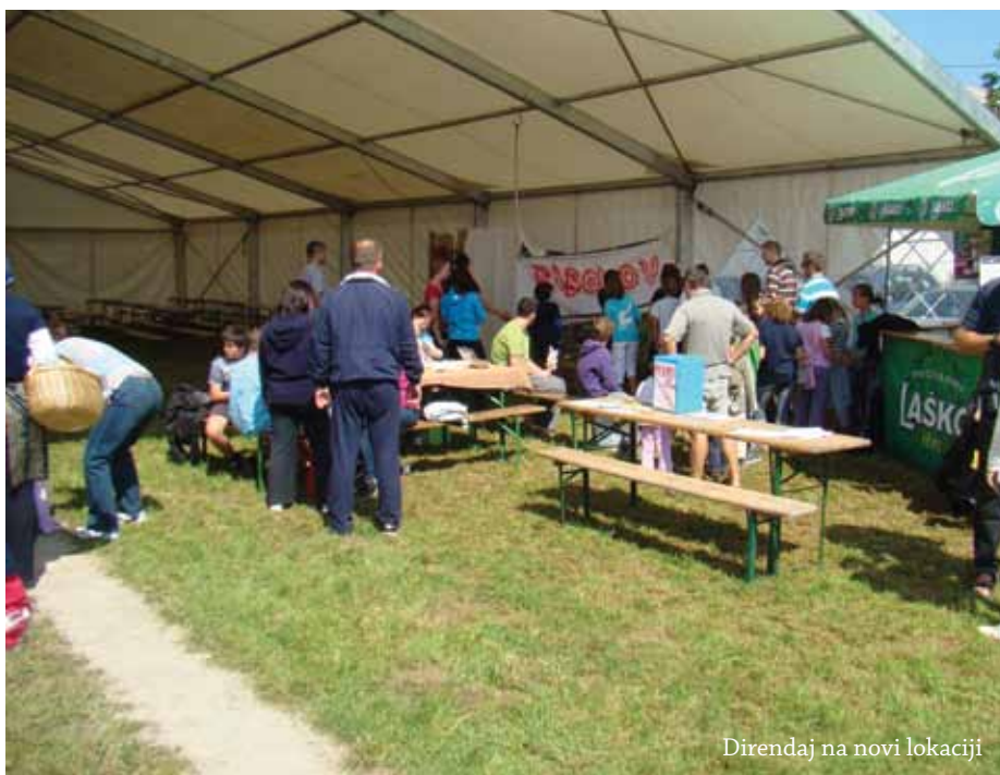
Direndaj na novi lokaciji