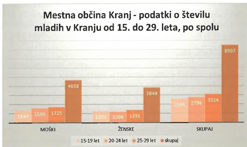
GRAF 2 Kranj – podatki o številu mladih v Kranju od 15. do 29. leta po spolu