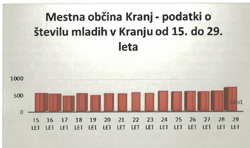
GRAF 1 Kranj – podatki o številu mladih v Kranju od 15. do 29. leta