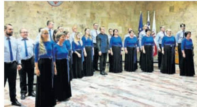
KPZ Mysterium na tretjem Naj se sliš'