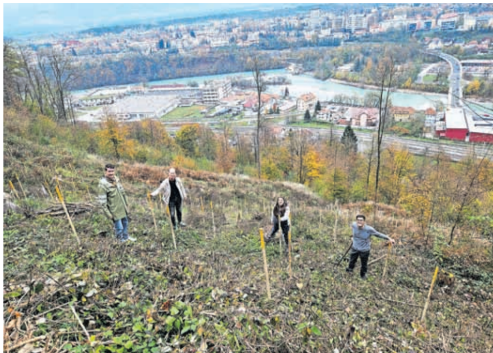
Na pobočju Šmarjetne gore, na območju, ki sta ga načela žledolom in lubadar, je Mestna občina Kranj zasadila tristo sadik oreha, divje češnje, pravega kostanja in lipe.

Tretje leto zapored so občanke in občani vseh 26 krajevnih skupnosti imeli možnost predlagati projek-