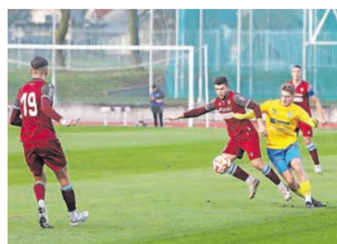
Nogometaši Triglava so na zadnji tekmi jesenskega dela na domači zelenici premagali goste iz Beltincev.