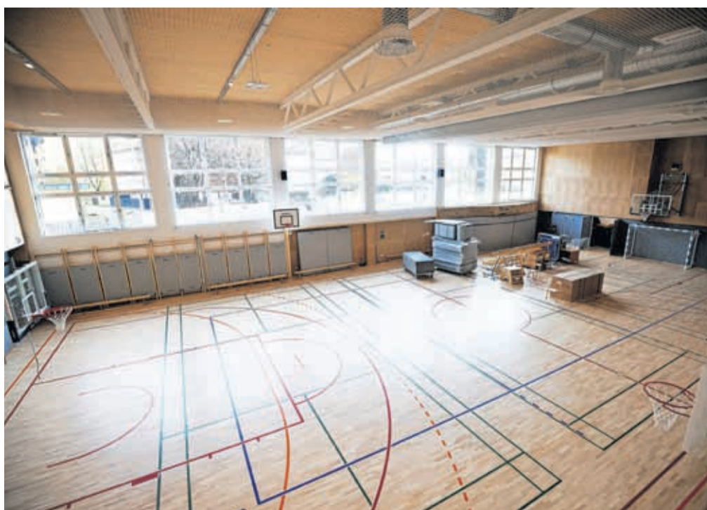
Na področju šolstva izstopa gradnja in opremljanje prizidka k OŠ Staneta Žagarja Kranj.

Nova turistična pridobitev v Kranju je od letos Jenkova rezidenca v starem mestnem jedru, v kateri je nekoč bival Simon Jenko. Ta ohranja kulturno dediščino, hkrati pa poudarja trajnostne smernice bivanja. Za trajnostni razvoj v turizmu je Kranj letos prejel platinasti znak, najvišji v okviru zelene sheme slovenskega turizma. Info center SOS proteus, v katerem biologi Zavoda Jamski laboratorij Tular izobražujejo obiskovalce o človeški ribici in pomenu podzemnih voda, se je uvrstil