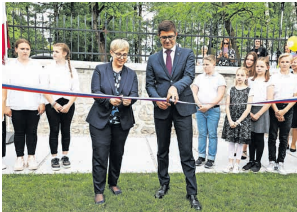
Novi Park slovenske himne sta odprla predsednica republike Nataša Pirc Musar in župan Matjaž Rakovec.

Podnebno pogodbo v okviru misije 100 podnebno nevtralnih in pametnih mest pa bo Evropski komisiji oddala spomladi 2024.