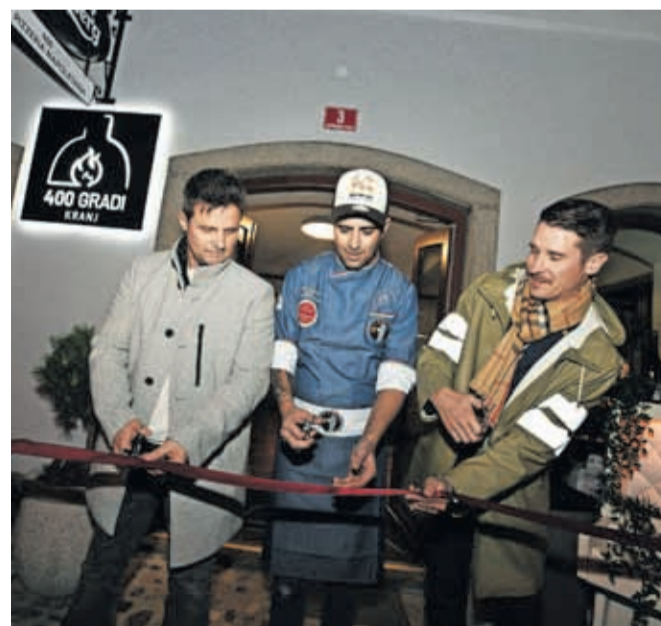
Novembra je v starem delu mesta vrata odprla nova picerija 400 Gradi, kjer postrežejo pristne napolitanske pice.

Na meniju boste poleg pic našli tudi italijanske pašte in lahke solate. Kulinarično potovanje lahko začnete z odličnimi predjedmi, kot so