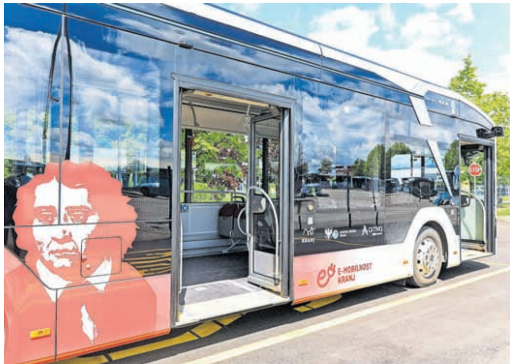
V mestni promet je Mestna občina Kranj letos uvedla električne avtobuse in postavila e-polnilnice zanje.

med sto najbolj trajnostnih zgodb na svetu. Kranj je skozi vse leto nosil naziv evropska destinacija odličnosti, ki mu ga je podelila Evropska komisija. Pojavila se je v svetovno znanih medijih, kot sta The Guardian in The Times, Evropska komisija je destinaciji omogočila tudi tridnevno predstavitev na največjem turističnem sejmu na svetu (ITB Berlin).