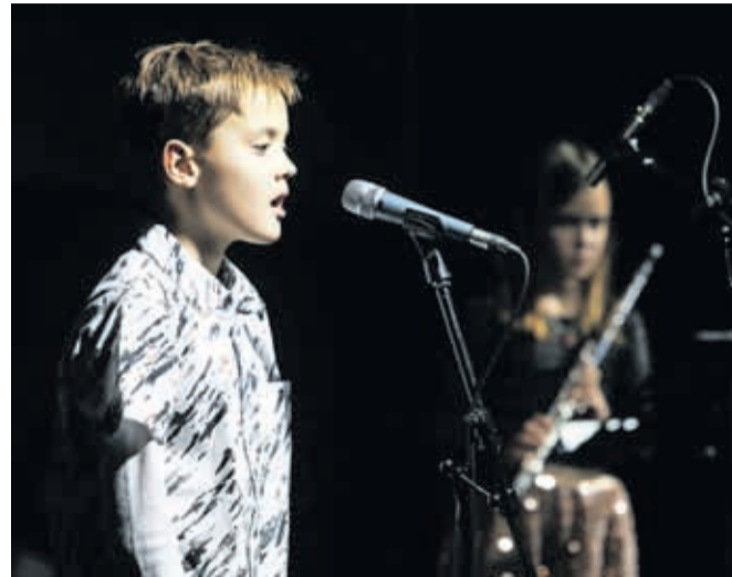
V kulturnem programu svečane akademije so nastopili mladi glasbeni in literarni ustvarjalci iz vasi in okolice.

Žabnica – V Žabnici letos praznujejo 1050. obletnico prve pisne omembe kraja v darilni listini nemškega cesarja Otona II. freisinškemu škofu Abrahamu junija 973, kar so pred tednom dni zaznamovali s svečano akademijo v tamkajšnji podružnični šoli, že pred poletjem pa so izdali tudi posebno brošuro. »Koliko velikih naselij in mest je že izginilo in koliko jih razkrivajo raziskovanja. Velikih mest, od katerih so ostale le ruševine brez življenja, naš kraj pa je tudi po 1050 letih še živ in ustvarjal,« je v govoru poudaril predsednik Krajevne sku-