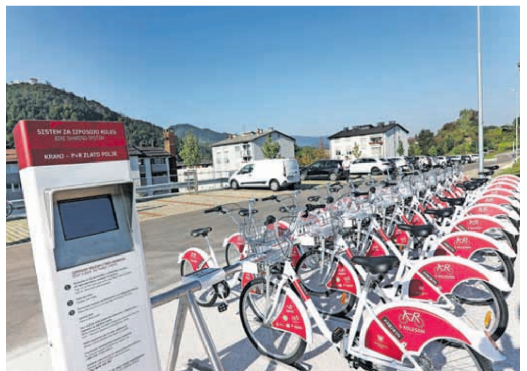
Na parkirišču P + R na Zlatem polju s 56 parkirnimi mesti je tudi novo postajališče sistema KRskOLE-SOM.