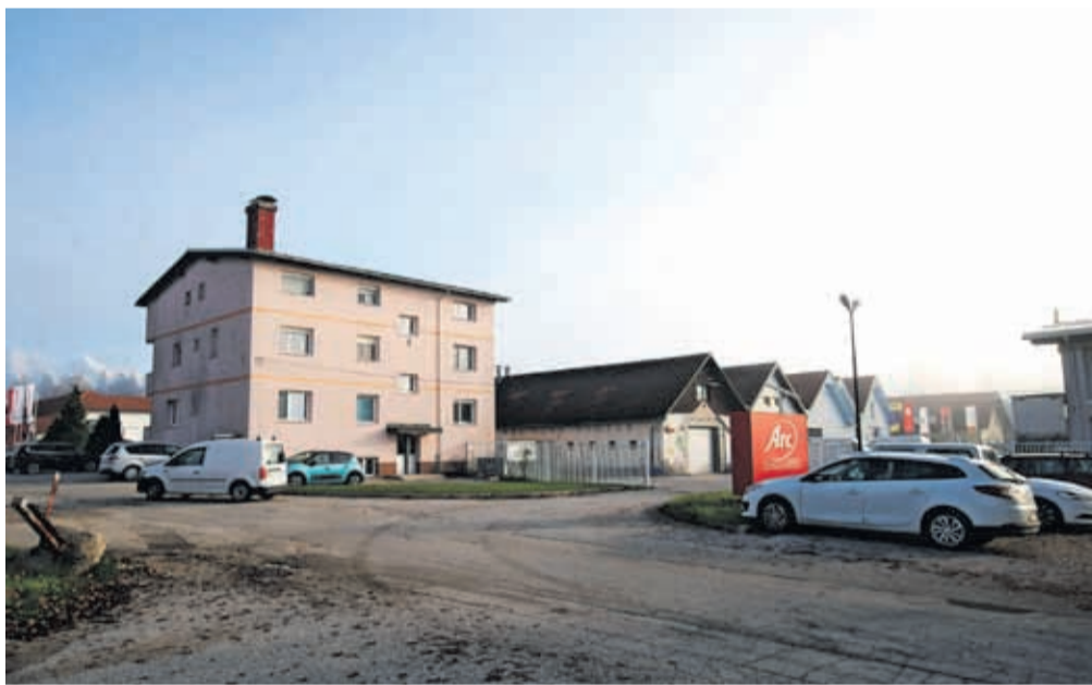
V Poslovni coni Hrastje je trenutno devetnajst podjetij.

»Poslovna cona Hrastje je največji razvojno-investicijski projekt MOK v zadnjih desetletjih. To je edina cona, ki ima možnost večje širitve. Zato je to za nas zelo pomemben mejnik. Zanimanje za komunalno opremljena zemljišča je veliko, saj je po nam znanih podatkih polovica zemljišč že prodana,« je dejal župan Matjaž Rakovec.