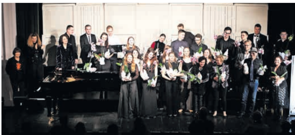
Skupinski priklon razigranih učiteljic in učiteljev ob koncu koncerta

krbel za veselo rajanje vseh 31 nastopajočih učiteljev in učiteljev ob skupnem zaključnem priklonu. Dokler bodo za našo glasbeno mladež skrbeli tako vrhunski glasbeniki, ki poleg profesionalnega igranja premorejo veliko dobre volje in srčnosti, da glasbo in pozitiven odnos do življenja nesebično delijo naprej, nam za glasbeni podmladek v mestu ni treba skrbeti.