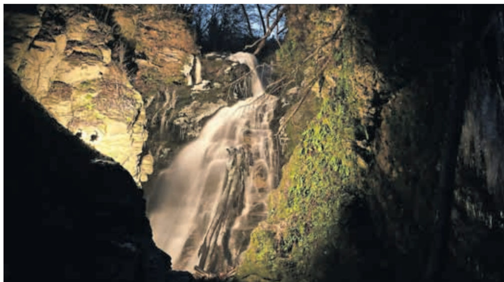
Krajevna skupnost Besnica že tradicionalno organizira nočni pohod k razsvetljenemu slapu Šum.

Zgornja Besnica – O rimskih toplicah, ki so bile v bližini slapu Šum, je v 17. stoletju v Slavi vojvodine Kranjske pisal že Valvasor. Danes so vidni le še ostanki bazenov, ki so jih leta 1954 zgradili na termalnem izviru in so jih še posebno radi obiskovali bolniki z revmatskimi obolenji. Čeprav toplic ni več, je obisk slapu še vedno zanimivo doživetje in odličan izlet, ki ga lahko podaljšamo v obisk učne poti Rovnik, katere del je tudi slap Šum. Slap je v Novi vasi v Zgornji Besnici – ta del kranjske občine je znan po čudoviti neokrnjeni naravi, kjer se lahko nadihate