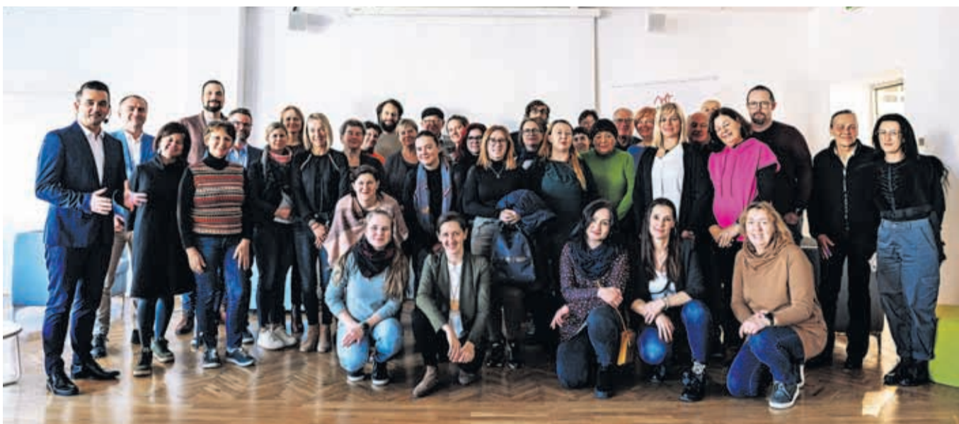
Dne 24. novembra je v kranjski Kovačnici v organizaciji Zavoda za turizem in kulturo Kranj potekal Kranjski turistični forum, kjer so se zbrali kolegi iz turističnega sektorja.

ki ga imajo le še štirje drugi slovenski kraji. Ta sega širše od enega trajnostnega turističnega produkta. Gre za trajnostna prizadevanja na različnih področjih v destinaciji, ki morajo dosegati dovolj visoko kakovost, predvsem pa kontinuiteto. Zato imamo v Kranju zeleno ekipo, sestavljeno iz 21 članov iz različnih institucij. Ekipa spremlja stanje, določa ukrepe in spodbuja različne deležnike, da bi se ti z različnimi certifikati zavezali trajnostnemu delovanju. Konec novembra smo tako Mestnemu svetu MOK uspešno predstavili akcijski načrt upravljanja in razvoja Kranja kot trajnostne destinacije do leta 2026. Ta v okviru trajnostnega turizma vključuje tudi ekonomski, družbeni in okoljski vidik. Okoljski certifikati so bili tudi ena izmed treh tem, o katerih smo konec meseca govorili na Kranjskem turističnem forumu. Enkrat letno namreč Zavod za turizem in kulturo Kranj povabi na druženje ves turistični sektor in ostale deležnike, s katerimi v destinaciji kreiramo turistično ponudbo. Poleg trajnostnih tem smo se tokrat dotaknili še trendov digitalnega marketinga v turizmu, največ časa pa smo namenili kulturnemu turizmu. Slovenska turistična organizacija je namreč za osre-