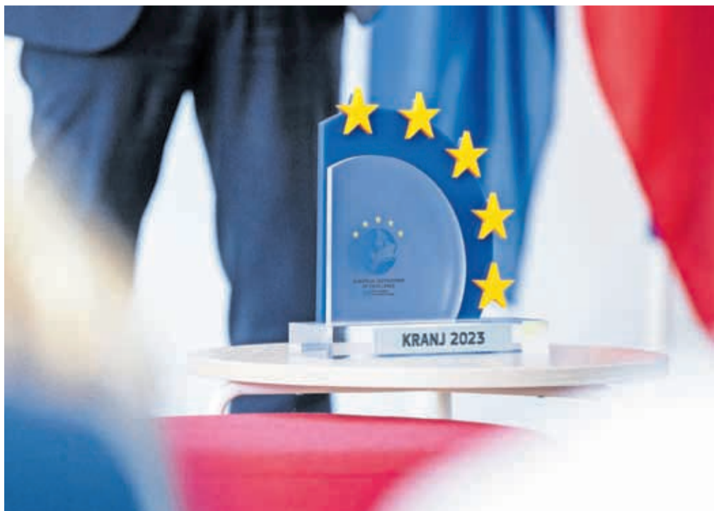
Kranj v letu 2023 nosi naziv evropska destinacija odličnosti, ki mu ga je podelila Evropska komisija.