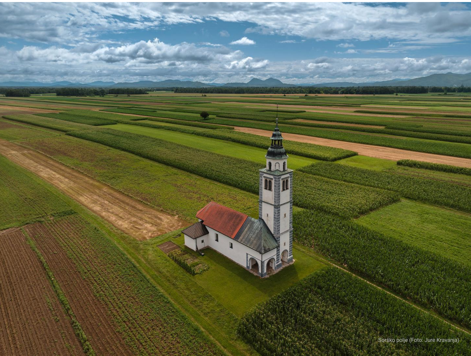
Sorško polje