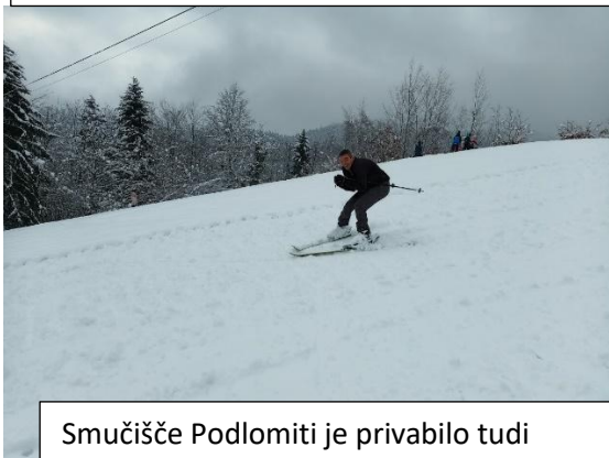
Smučišče Podlomiti je privabilo tudi starejše občane 😊 .