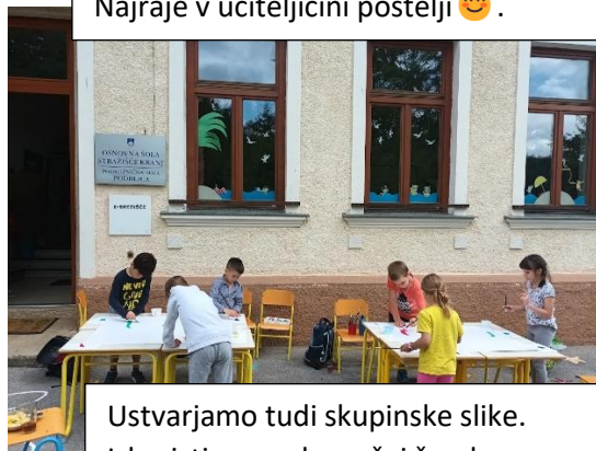
Ustvarjamo tudi skupinske slike. Izkoristimo vsak sončni žarek.