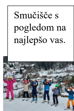
Smučišče s pogledom na najlepšo vas.