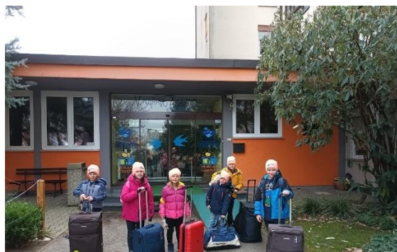
V ČŠOD smo bili kot družina. Staršev nismo pogrešali niti za trenutek.