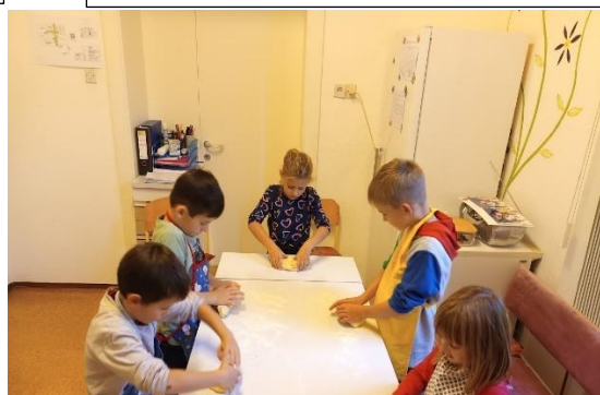
Včasih si izposodimo tudi Zinkino kuhinjo. Tokrat smo pekli pletenice in ptičke.