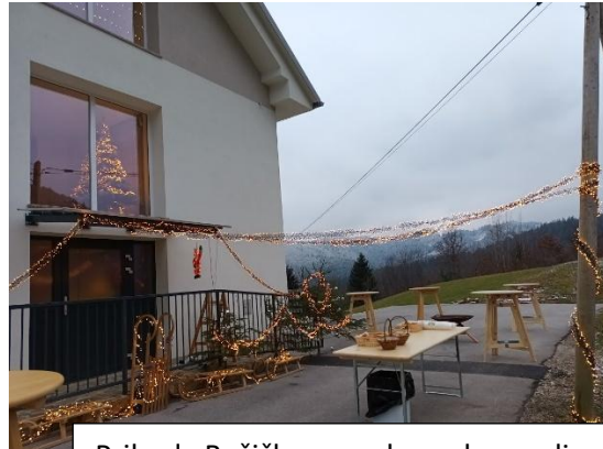
Prihoda Božička se vedno zelo veselimo... Še posebej druženja ob ognju.