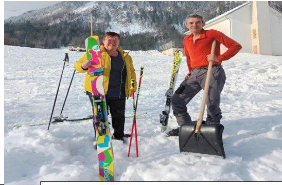
Podbevški ratrak in šerpa na smučišču Podlomiti. Hvala za teptanje.