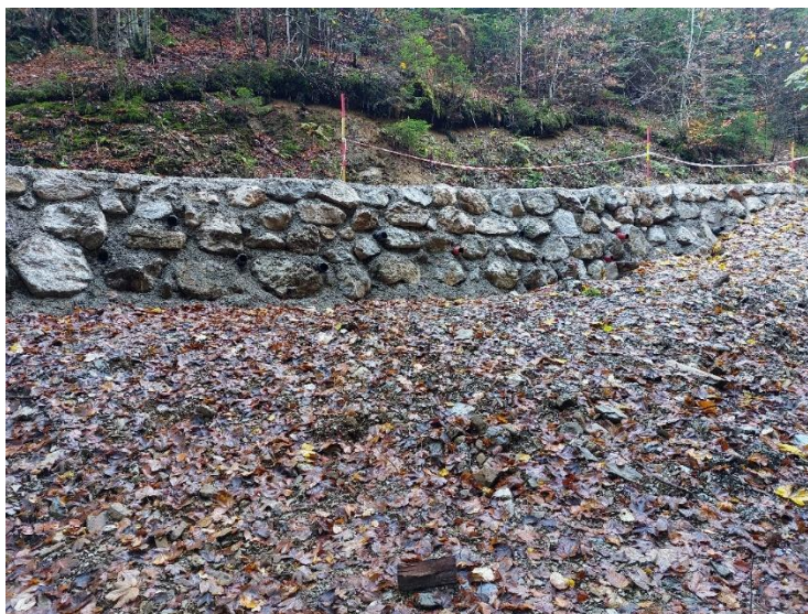
Slika 2: Novi podporni zid ceste v Topolje

Avgustovsko neurje območje naše krajevne skupnosti ni povsem zaobšlo. Tako je na več mestih voda odnesla cesto iz Nemilj v Topolje, ki je bila sprva povsem neprevozna, nato pa skoraj dva meseca bolj na lastno odgovornost. Na najbolj kritičnem delu je bilo potrebno zgraditi dva podporna zidova. Poleg tega je bilo potrebno sanirati manjši plaz tik pod cesto od Njivice proti Besnici ter na poti iz Podblice proti Prevolam kamnit propust, ki ga je odnesla hudourniška voda. Zadnje neurje v novembru pa je sprožilo še plaz v Nemiljah na travniku blizu Bognarja in to na mestu, kjer poteka tudi trasa nemiljškega vodovoda. Bati se je, da bi nadaljnje plazenje ogrozilo oskrbo s pitno vodo prvih štirih hiš v Nemiljah.