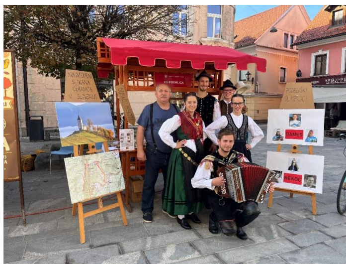
Slika 3: Predstavniki KS Podblica na dnevu krajevnih skupnosti MOK