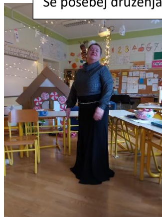
Obiskala nas je operna diva. Pela ni, bila je pa lepa 😊 .