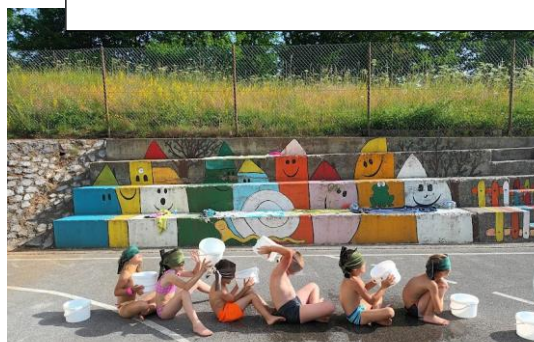
Poleti se veselimo zabavnih vodnih iger.