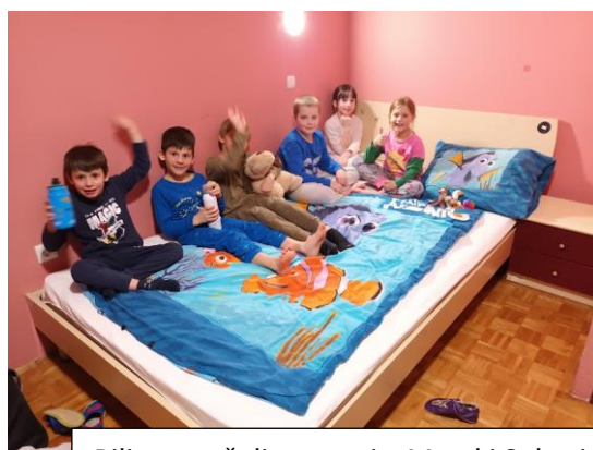
Bili smo v šoli v naravi v Murski Soboti. Najraje v učiteljni postelji 😊.