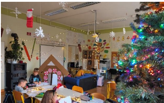
Tudi v razredu si pričaramo praznično vzdušje...