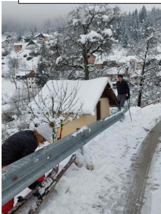
Smučamo tudi tam, kjer je najbolj zabavno. Okužila sta se tudi Murnova otroka in popoldan drvela po celem snegu 😊 . Bravo!