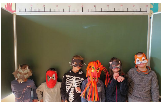
Izdelujemo maske po svojem okusu. Vsako leto pa izdelamo tudi eno skupinsko.