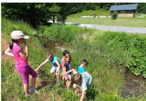
Oblezemo vse kotičke, od Jamnika proti Mohorju in do Nemilj.