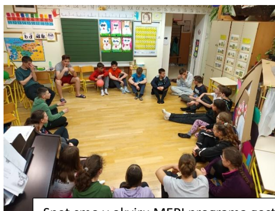
Spet smo v okviru MEPI programa gostili devetošolce, ki so pri nas tudi prespali.