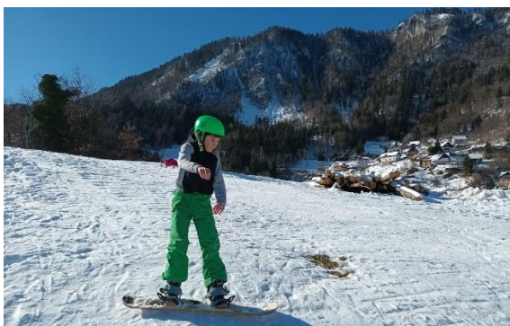
Poleg smučanja se v Podlomitih lotimo tudi bordanja. Dobro nam gre.