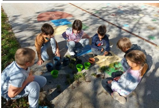
Tudi letos smo poskrbeli za zelene rastline.