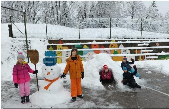
Sneženih skulptur se vedno zelo razveselimo.