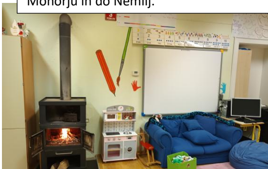
Ob hladnih dneh zakurimo v kaminu. Počutimo se kot doma.