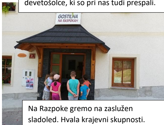
Na Razpoke gremo na zaslužen sladoled. Hvala krajevni skupnosti.