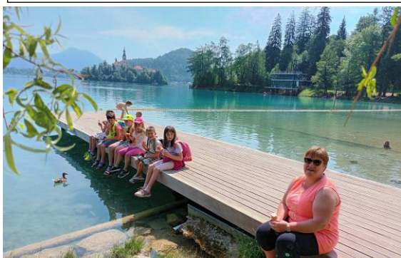
Privoščili smo si izlet na Bled. In seveda smo tudi skakali s pomola 😊. Kdo ne bi?