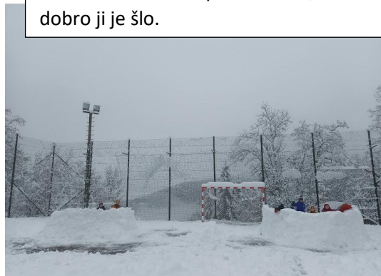
Sneg je naše največje veselje.