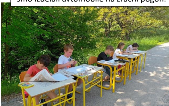
Spomladi in jeseni dneve najraje preživimo zunaj. Selimo se po soncu.