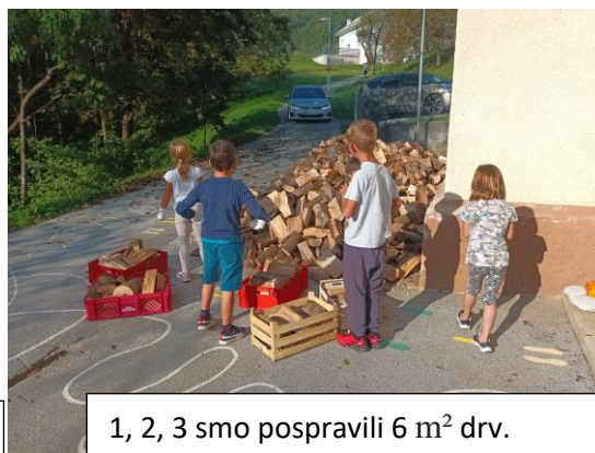
1, 2, 3 smo pospravili 6 m 2 drv.