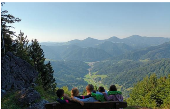
Povzpeli smo se na Dražgoško goro in ujeli čudovit razgled.