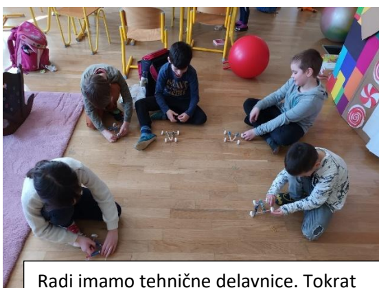
Radi imamo tehnične delavnice. Tokrat smo izdelali avtomobile na zračni pogon.