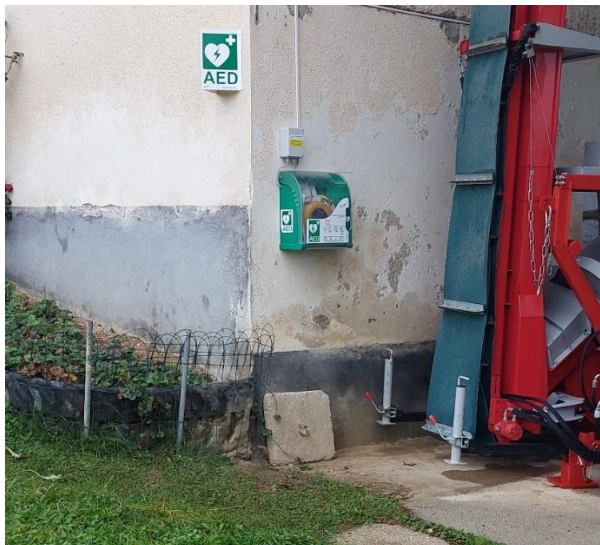
Slika 4: Defibrilator na Njivici

Tako kot običajno smo tudi letos organizaciji ZB simbolično pomagali pri izkazu spomina na mrtve v vojni ter tradicionalnem pohodu in srečanju pri Tehniki Meta.