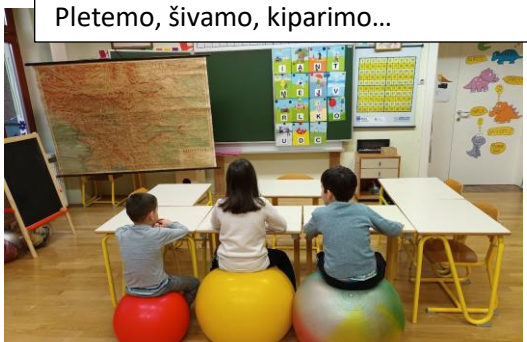
Stole včasih zamenjamo z žogami ali kavčem.