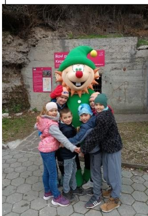
Obiskali smo kranjske rove in škrate Krančka.