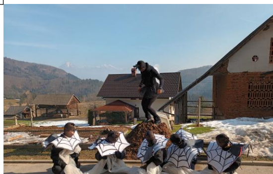
Za pusta smo obiskali domačine. Muha je oblezla vsak gnoj 😊.