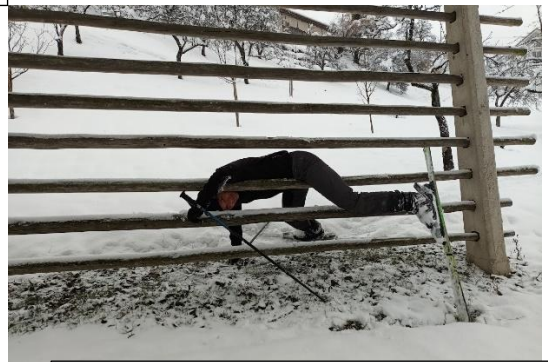
Včasih se tudi ni izšlo 😊 .