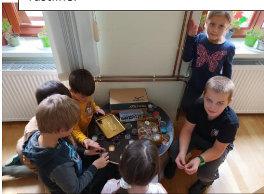
Radi imamo tudi ročne spretnosti. Pletemo, šivamo, kiparimo...