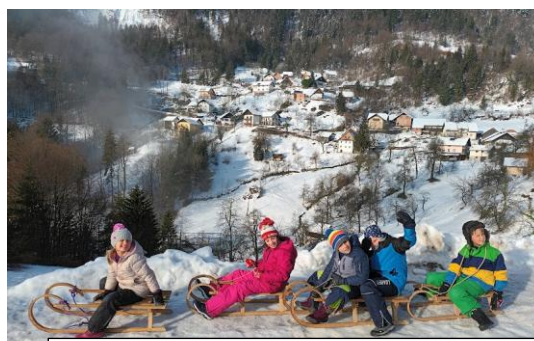
Ko zapade dovolj snega, se radi sankamo. Večkrat gremo do Mlina.