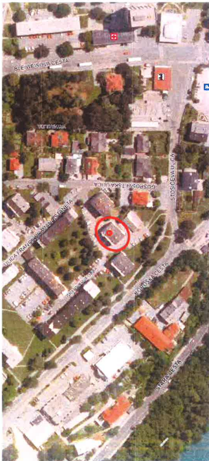
delež (do 1/5) na stanovanju Gradnikova ulica 3, Kranj