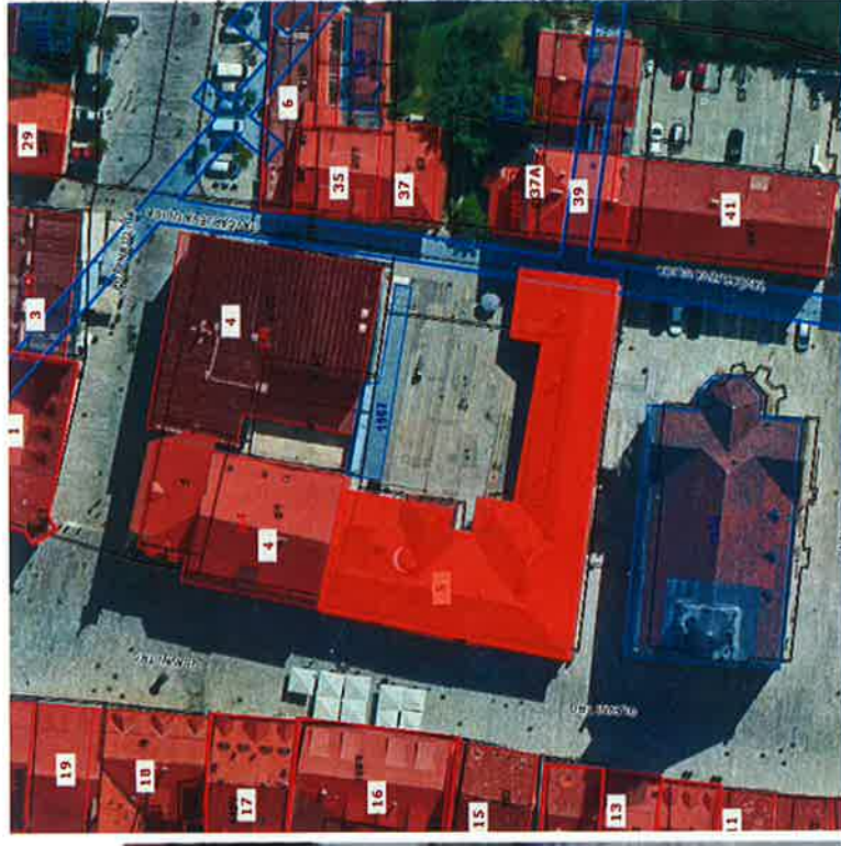
Del stavbe na naslovu Glavni trg 5 v Kranju